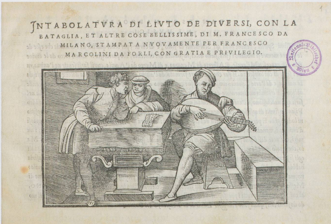
Abb. 4: Titelblatt von: Intabolatura di liuto , Venedig 1536 / Wien, Österreichische Nationalbibliothek, Signatur SA.78.C.28 19