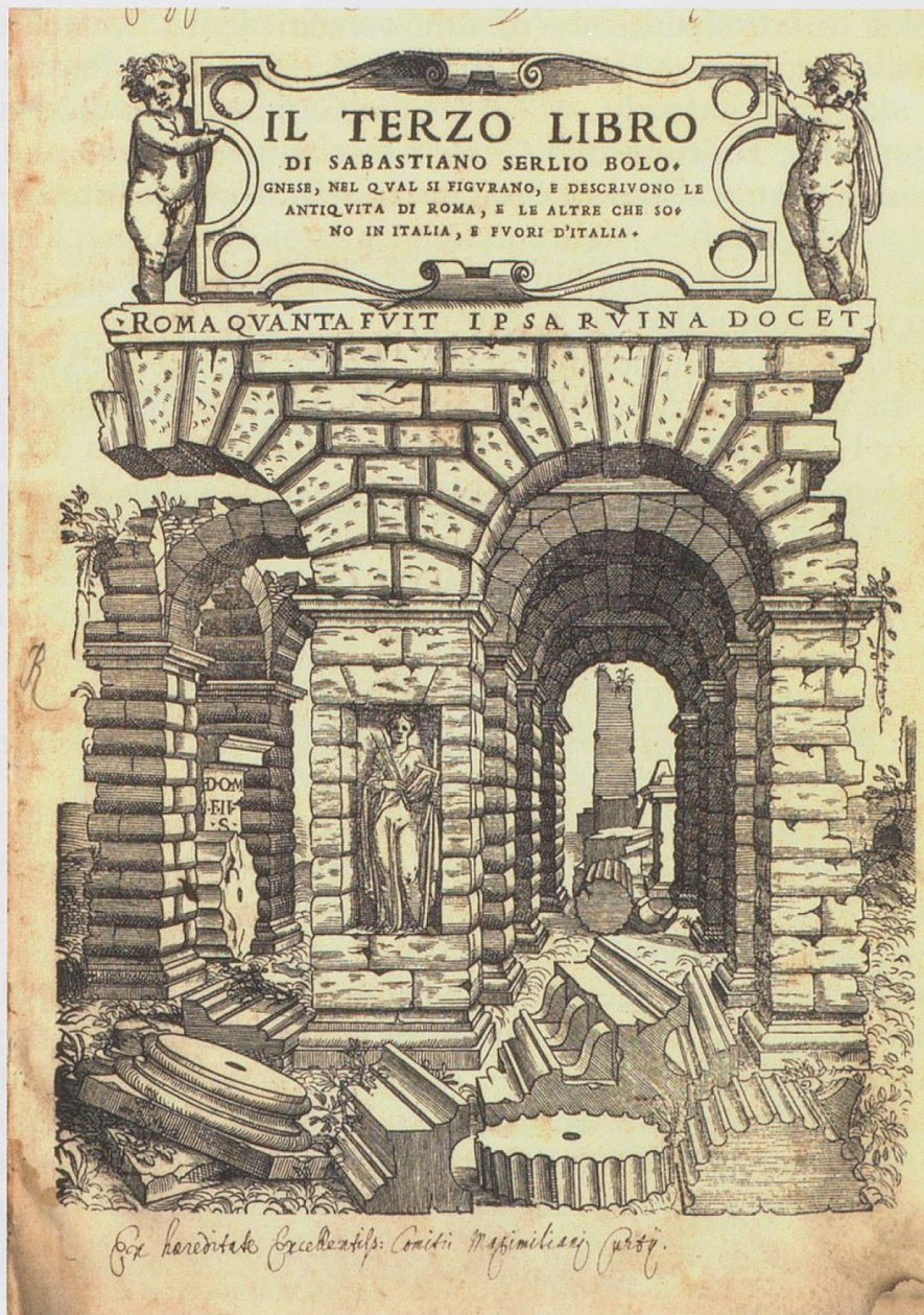
Abb. 7: Titelblatt Terzo libro di Architettura , von Sebastian Serlio, Venedig 1540 / München, Bayerische Staatsbibliothek, Signatur Res/2 A.civ 197