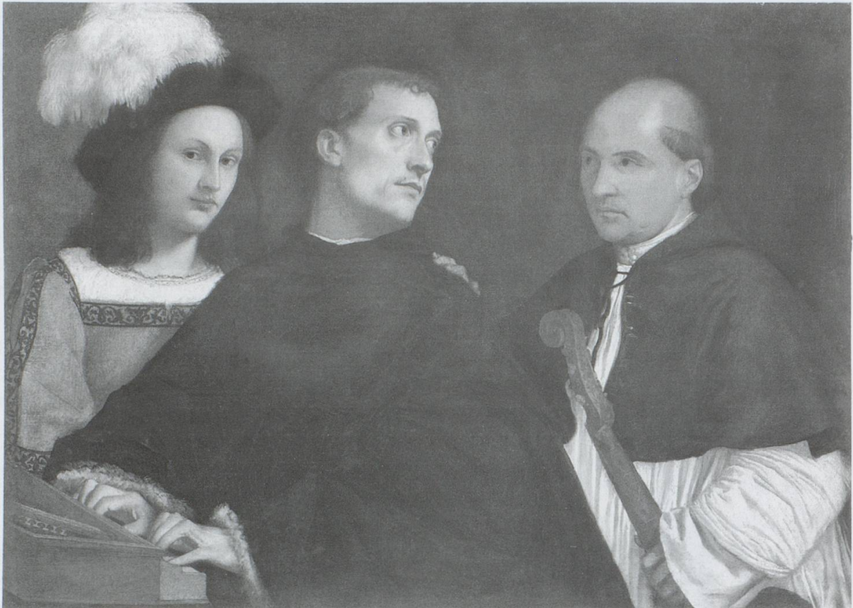
Abb. 13: Tizian (1488/1490–1576): sogenanntes „Concerto“, um 1510 / Florenz, Palazzo Pitti, Inv. Palatina Nr. 185

Ganassi könnte derartige Gemälde, wie etwa das sogenannte Concerto Tizians 42 (Abb. 13) gesehen haben: Rechts steht ein Kleriker, der ein Saiteninstrument hält, in der Mitte ein Mann, dessen Hände sich in Spielhaltung bei der Tastatur eines Virginals befinden, und links dahinter ein modisch herausgeputzter Jüngling, der einer anderen sozialen Schicht wie auch Realitätssphäre anzugehören scheint (er verkörpert einen Typus, während die beiden anderen Männer portraitiert erscheinen). Während die musikalische Aktion aufgehalten ist, hält das subtile Beziehungsnetz, das sich zwischen den drei Figuren anhand von Blicken, Gesten und Attributen entspinnt, die Szene in einer rätselhaften, spannungsreichen Schweben.