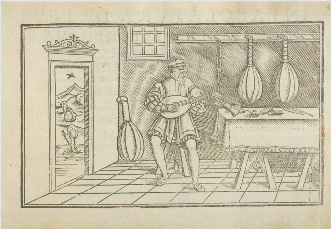
Abb. 5: Titelbild von: Intabolatura de leuto de diversi autori , Mailand 1536 / Wien, Österreichische Nationalbibliothek, Signatur SA.76.C.23 18