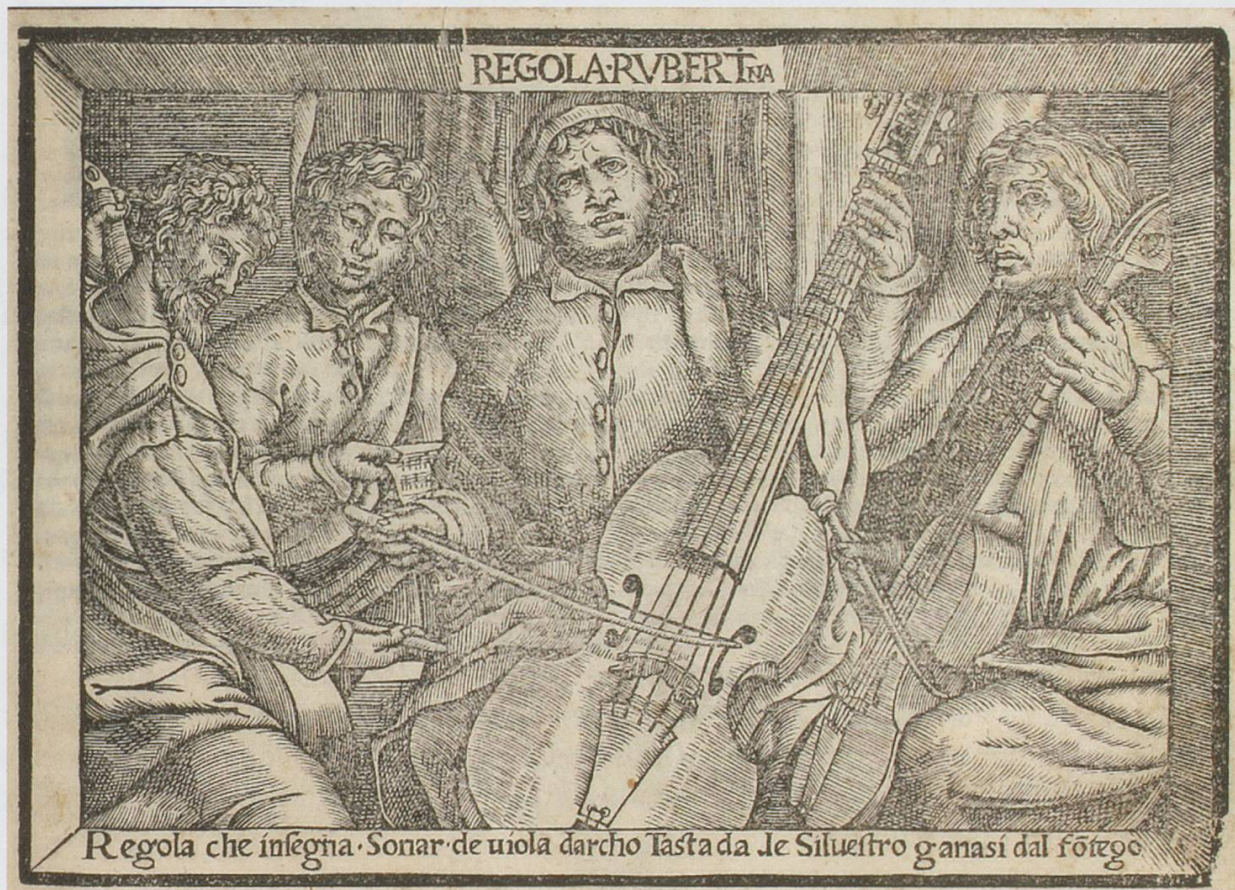
Abb. 1: Titelblatt von: Silvestro Ganassi, Regola Rubertina , Venedig 1542 / Bologna, Museo internazionale e biblioteca della musica, Signatur B.84

Da originale Musikinstrumente aus der Zeit vor 1550 nicht überliefert sind, werden Instrumentendarstellungen in den Bildkünsten für die Organologie zu bedeutenden Quellen. Studien aus diesem Fachbereich stützen sich allerdings meist nur auf Ausschnitte aus den Bildwerken, wobei sie deren Kontext und Medialität nur ungenügend berücksichtigen – so auch Ian Woodfields The Early History of the Viol von 1984, die auf seiner Sammlung von Bildmaterial zur Ikonographie der frühen Viola da Gamba basiert. 1 Das auf die dargestellten Instrumente beschränkte Interesse führt oftmals dazu, die gewählten