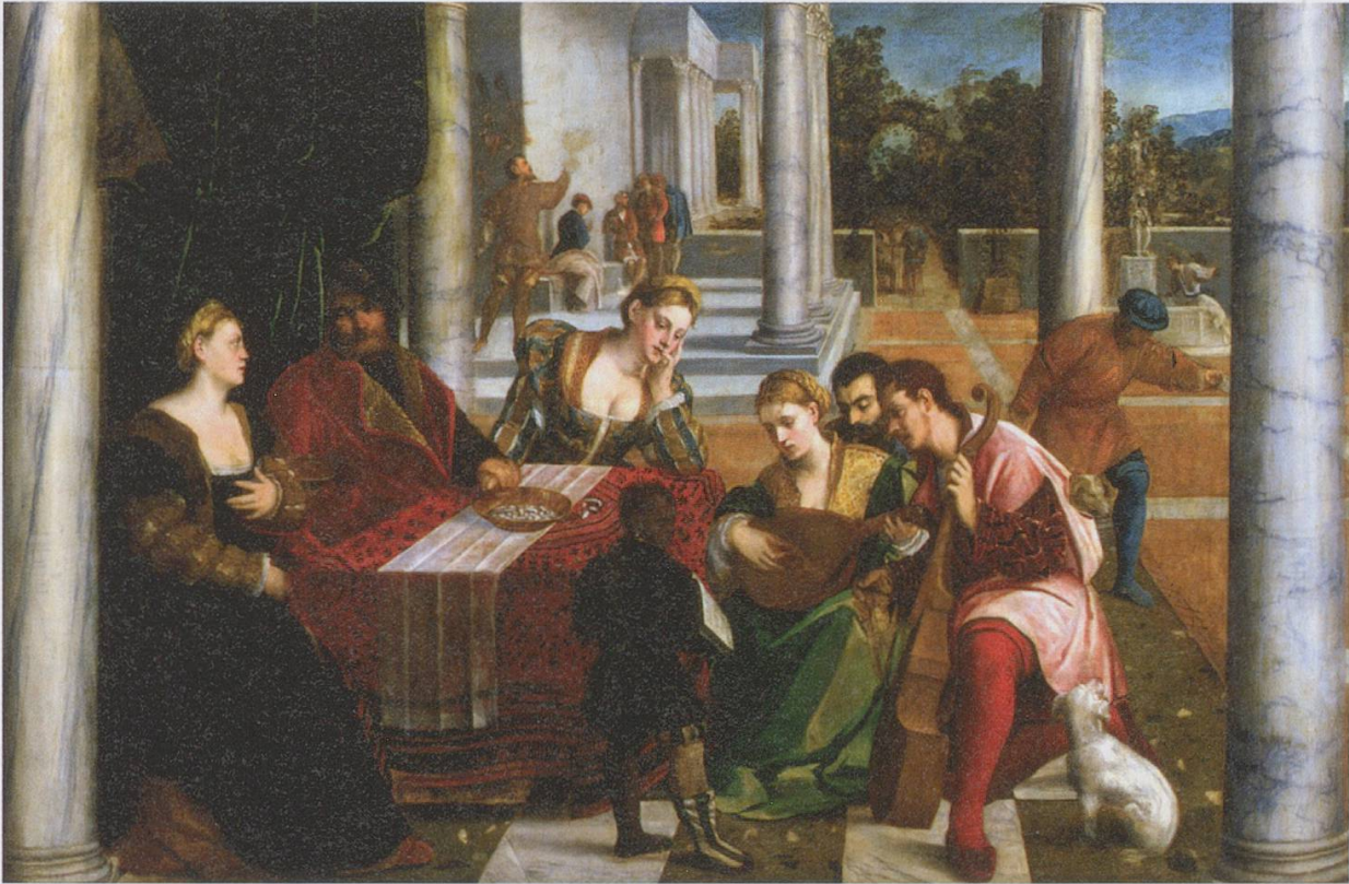
Abb. 11: Bonifacio de' Pitati (1487–1553): Das Gleichnis vom reichen Mann und dem armen Lazarus, um 1535–1540, Venedig, Gallerie dell'Accademia, Inv. 291

der Zeit vor 1550 aus Venedig oder dem Veneto. 28 So besteht die venezianische Gambenikonographie bis in die 1540er Jahre aus Einzelfällen, wie ein Vergleich mit einem Gemälde von Bonifacio de' Pitati zeigt, das um 1535/1540 in Venedig entstanden ist. In Bonifacios Darstellung einer biblischen Parabel figuriert die Gambe innerhalb eines gemischten Ensembles (Abb. 11). 29