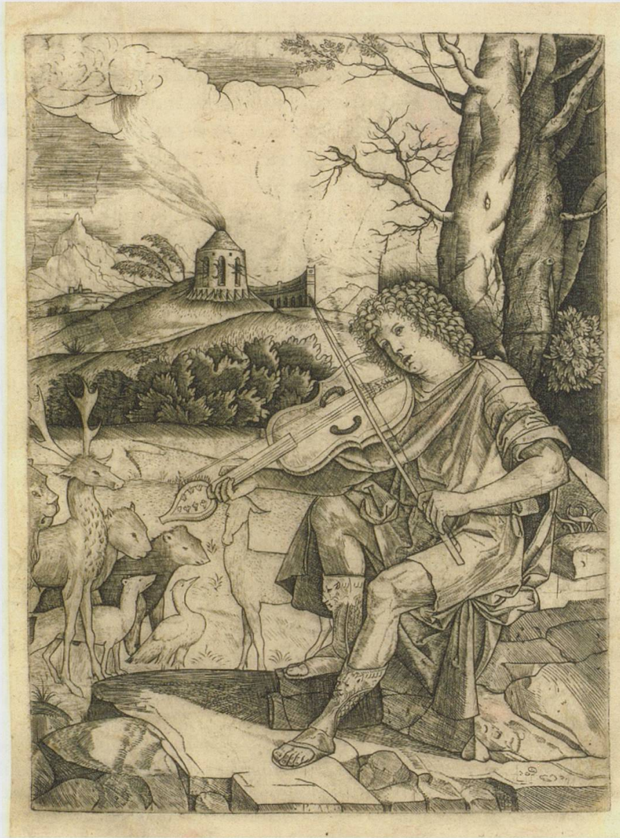
Abb. 12: Benedetto Montagna (1481–1558): Orpheus, um 1500–1520 / London, British Museum, Inv. 1895,0915.76; Creative commons, c The Trustees of the British Museum

der Musik. 37 Die zahlreich erhaltenen Darstellungen zeigen die Verbreitung und Bekanntheit dieses Motivs, etwa der zwischen 1500 und 1520 entstandene Kupferstich von Benedetto Montagna, mit einem Lira da braccio spielenden Orpheus in einer Landschaft mit Tieren (Abb. 12). 38