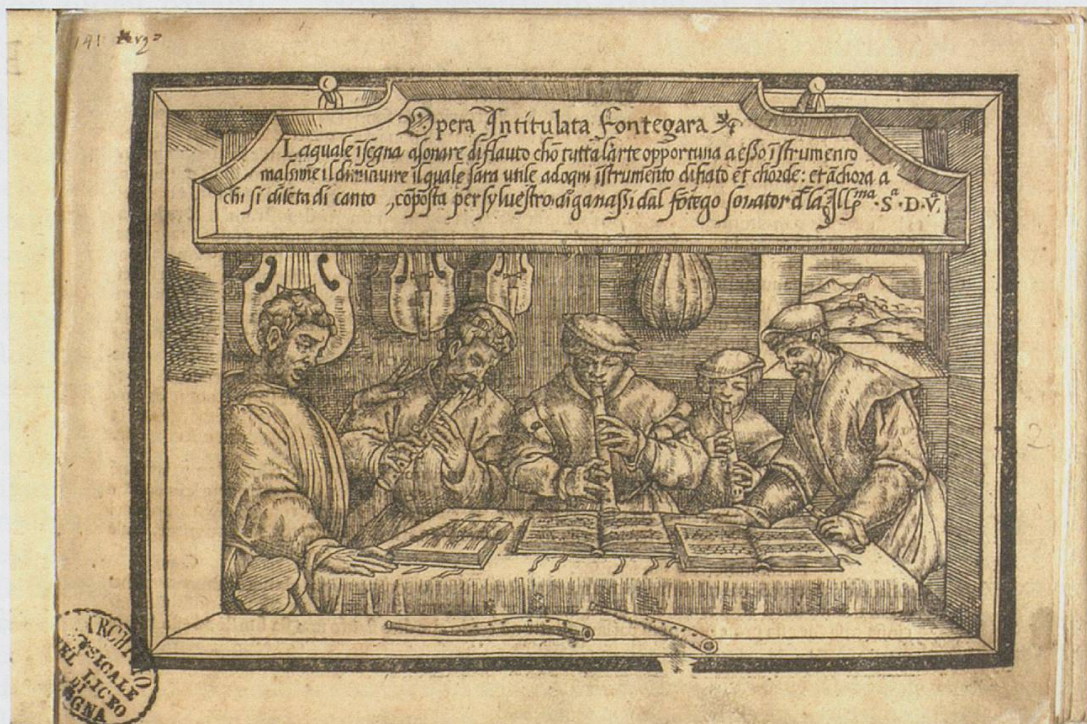
Abb. 3: Titelblatt von: Silvestro Ganassi, La Fontegara , Venedig 1535 / Bologna, Museo internazionale e biblioteca della musica, Signatur B.83