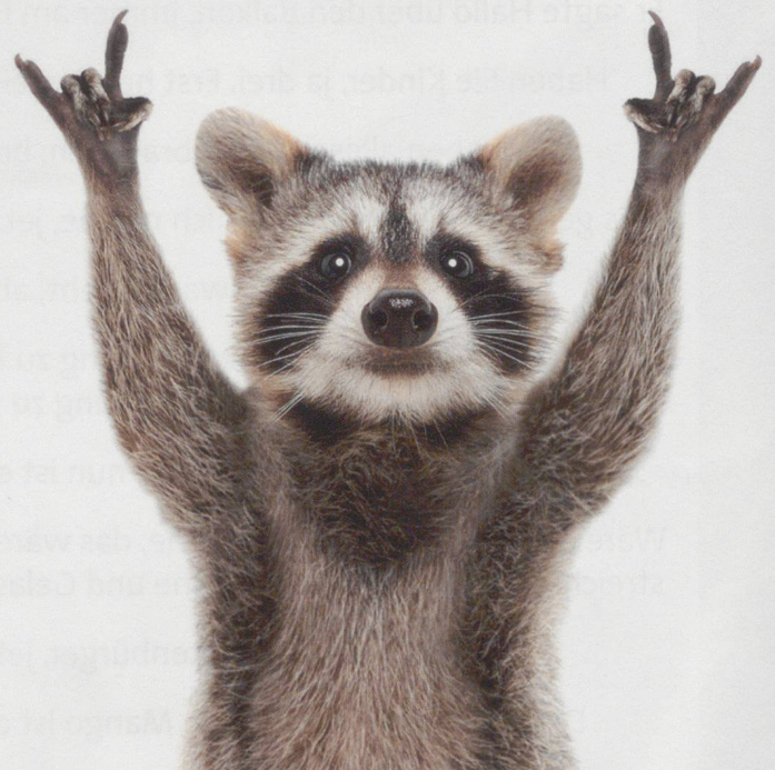
Das Dirigat nimmt bei der Liederwahl eine wichtige Rolle ein.

Vor allem in den letzten zwanzig Jahren hat sich das Chorwesen in musikalischer Hinsicht deutlich verändert. Viele Chöre existieren nicht mehr, weil die Verjüngung und gleichzeitige Anpassung der musikalischen Entwicklung nicht gelungen ist. Eine solche Aufgabe ist nicht in zwei oder drei Jahren zu lösen. Es ist eine Daueraufgabe. Vor allem ist diese abhängig von der