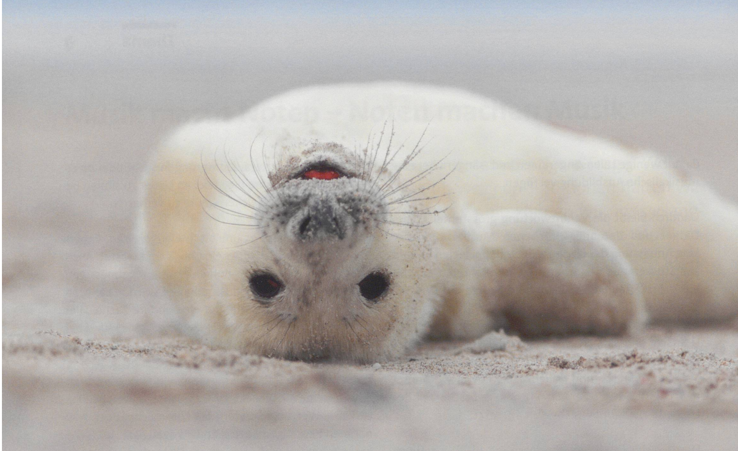
Und wenn Lieder manchmal schwer erscheinen und eine grosse Herausforderung sind, so hilft eine kurze Entspannung immer.

den Ersatz von Mitgliedern gekämpft werden muss. So wird aus praktischen Gründen das Thema Musik im Vorstand behandelt und in Zusammenarbeit mit dem Dirigat besprochen.