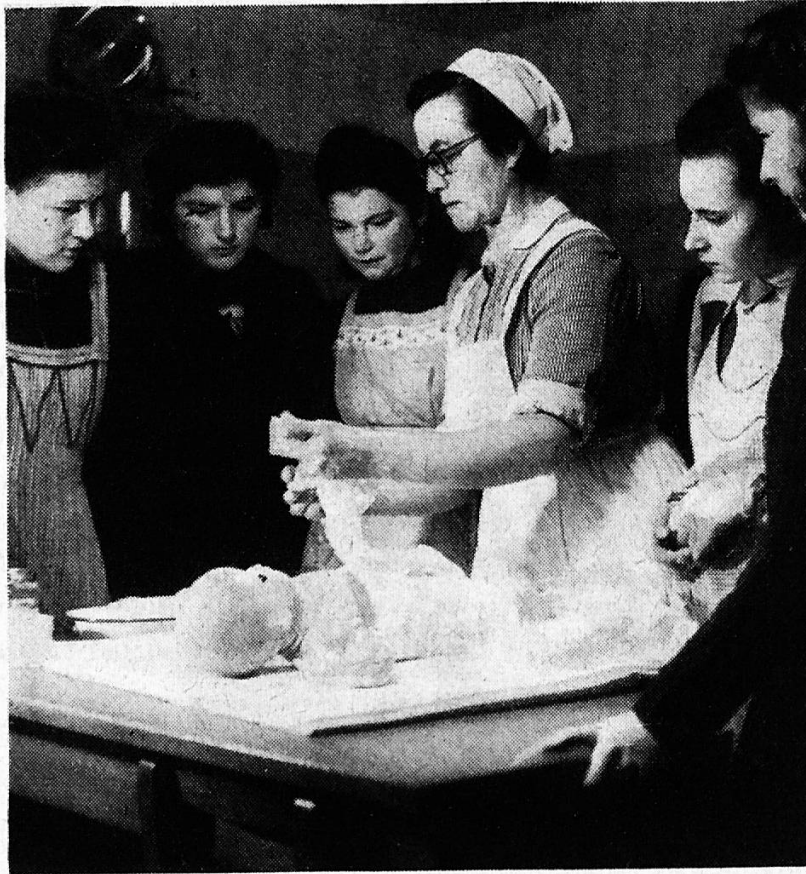
Die Gemeindegeschwester beim Unterricht an der Hauswirtschaftlichen Fortbildungsschule Schlieren (ZH).

L'infirmière visiteuse (ou sœur visitante) à la consultation aux mères à Schlieren.