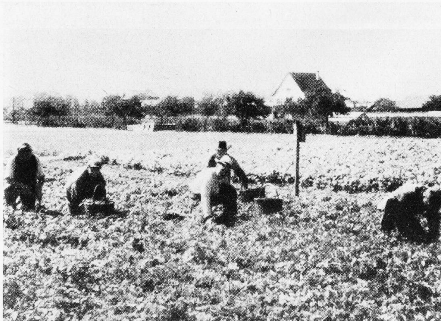
Die Arbeitsgemeinschaft am Werk