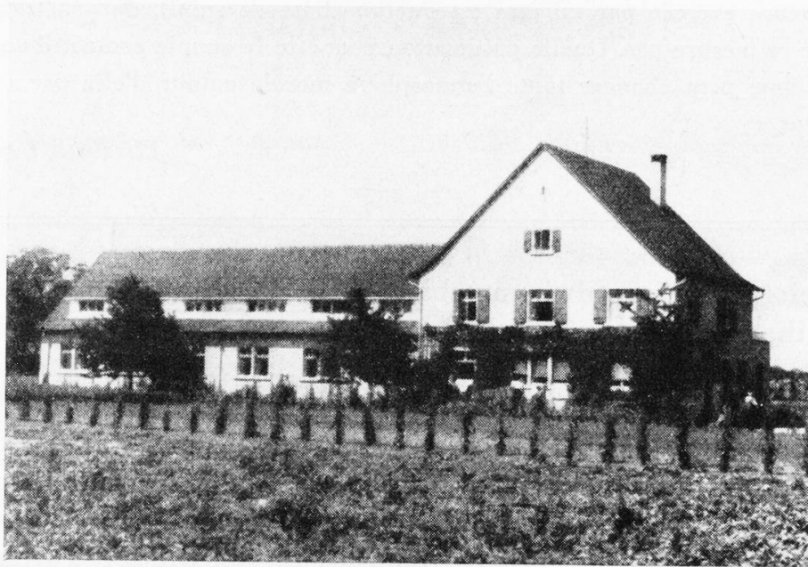
Das Wohnhaus der Angestellten

Patienten öfter die Frage: Was sollen diese Menschen anfangen, die nicht mehr der Spitalpflege bedürfen und doch wegen ihrer mehr oder weniger schweren Invalidität nicht im Stande sind, wieder einem normalen Arbeitsprozess eingegliedert zu werden? Soll man sie der öffentlichen Fürsorge überlassen und sie damit mehr und mehr jedes Selbstvertrauens berauben? Oder lässt sich ein Weg finden, auch ihre reduzier-