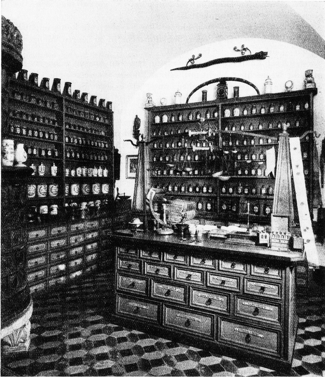
Apotheke aus dem Kloster Muri (AG)

Schweizerisches Landesmuseum Zürich (Nr. 39124)