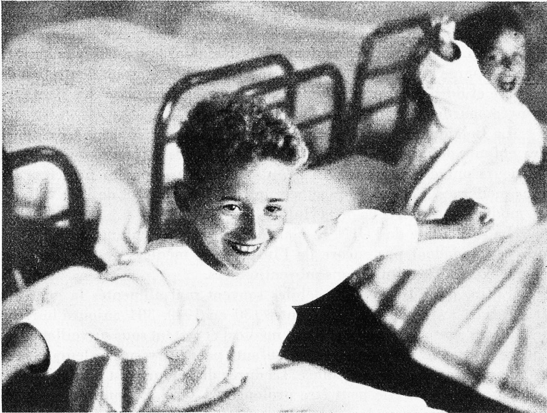
Le réveil dans une colonie de l'O. N. E.