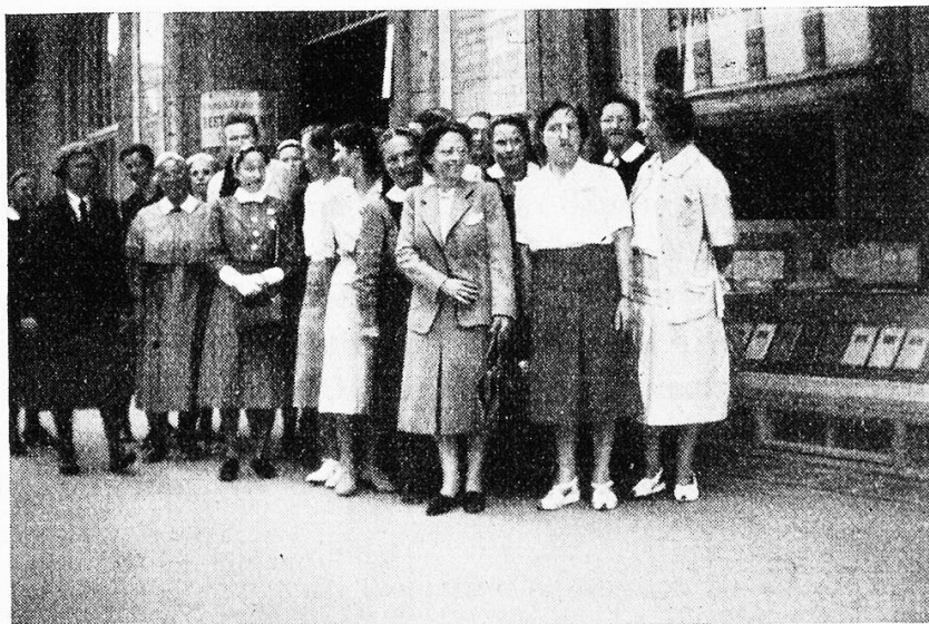
Die Teilnehmerinnen am 4. Fortbildungskurs für Gemeindegewestern, der im Mai/Juni 1950 vom SVDK in Zürich durchgeführt wurde

tika (Penicillin, Chloromycin, Aureomycin, Polymycin, Bactracin usw.) in der Kinderheilkunde, Kinderchirurgische Probleme. Weitere Sektions-sitzungen wurden der modernen Herzchirurgie, der BCG-Impfung, dem Cortison, dem ACTH gewidmet (auf letztere werden grosse Hoffnungen gesetzt zur Bekämpfung zahlreicher Krankheiten, u. a. des chronischen Rheumatismus).