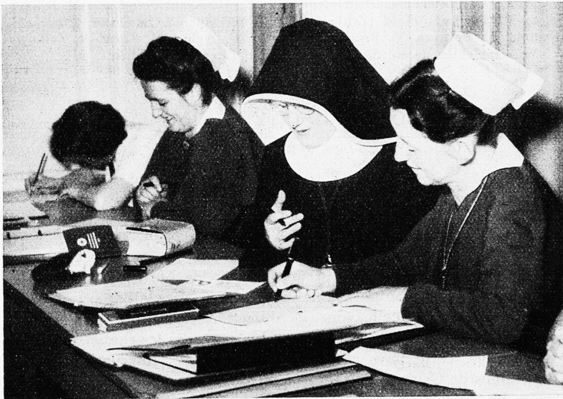
Nos infirmières à l'Ecole de perfectionnement