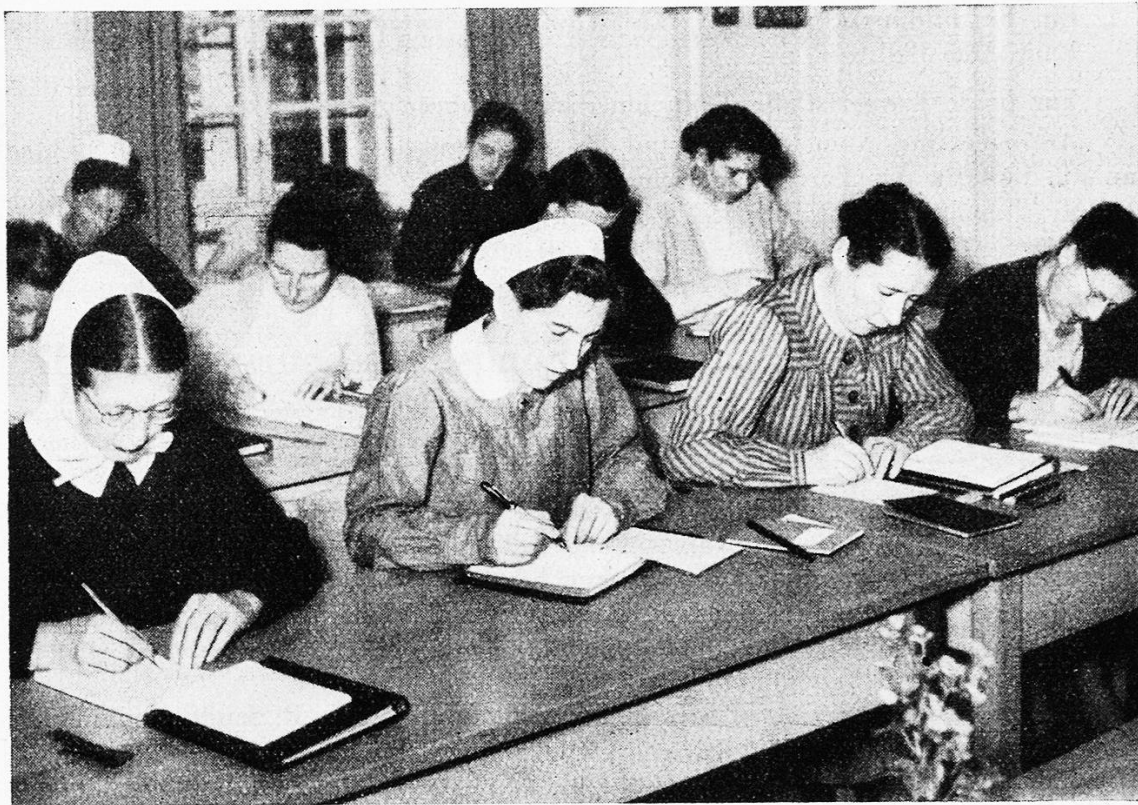
Hörerinnen unserer Fortbildungsschule