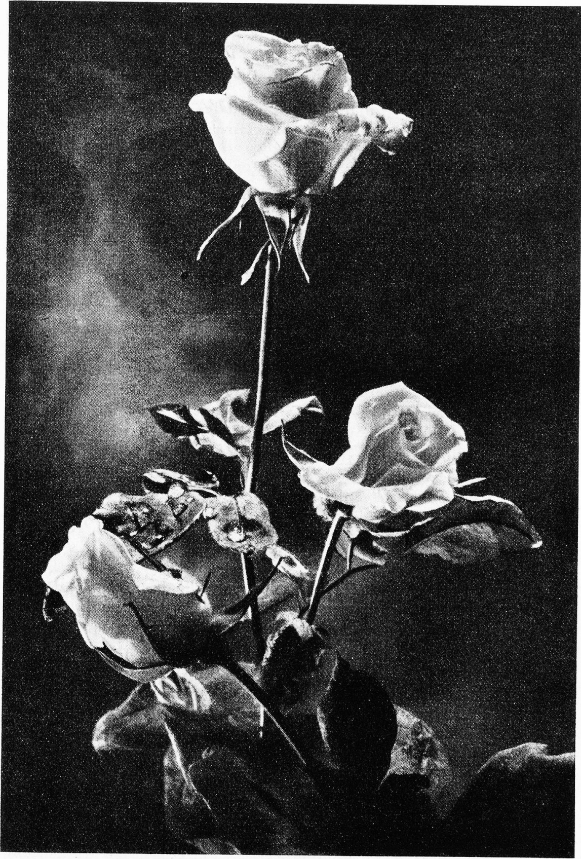
LEO HILBER, Photograph, - Camera - / C. J. Bucher, Luzern