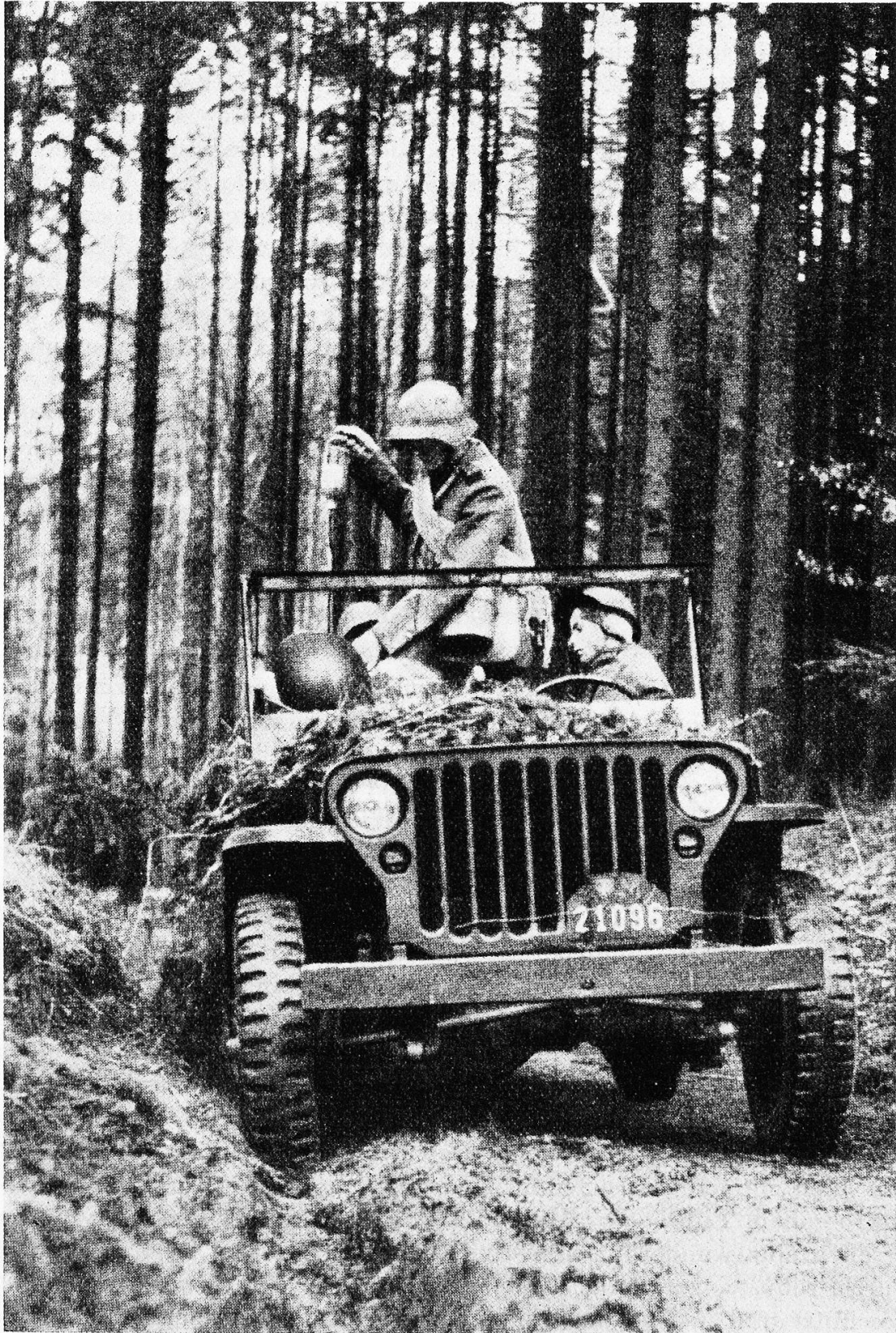
Der Blutersatz-Notfalldienst unserer Rotkreuz-Kolonnen bei einer Vorführung mit „Schein-Patienten“