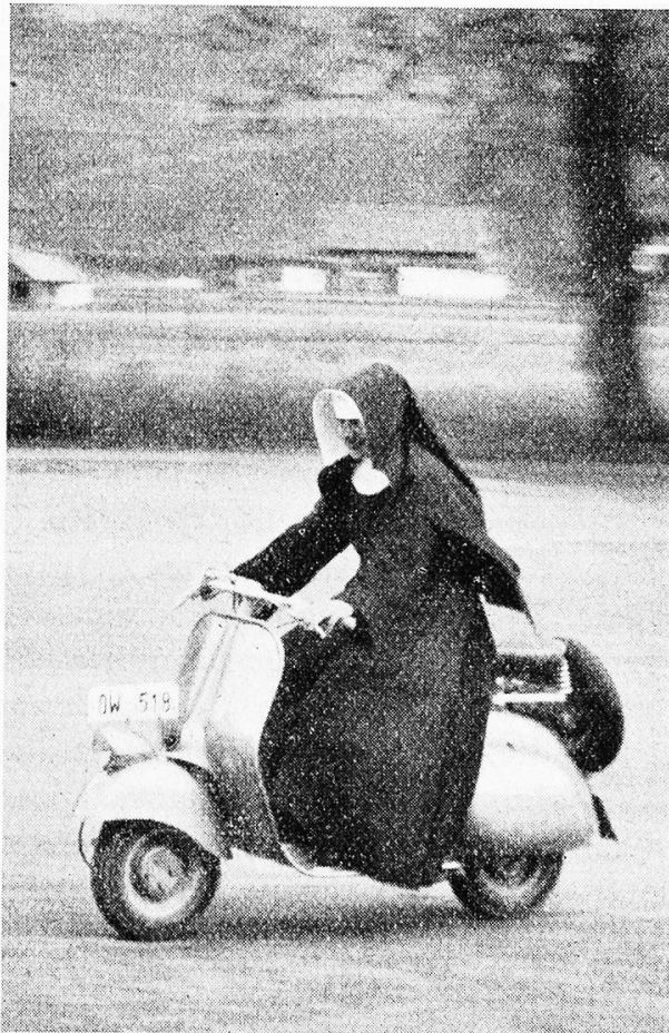
Die motorisierte Gemeindeschwester (Franziskanerin) im Bergtal

Rentré en 1539 à Paris, Ambroise Paré s'y marie. Ses succès s'étaient vite répandus. Pourtant, il est tenu à l'écart par ses confrères qui lui reprochent de n'avoir aucun diplôme ni aucun grade et d'ignorer le latin. C'est pourquoi, souffrant de ces critiques, Maître Paré, qui jouit de l'amitié des grands, préfère les champs de bataille. Il repart pour Perpignan, avec M. de Brissac, grand maître de l'artillerie qui, dès le début de la campagne contre les Espagnols, est grièvement blessé d'un coup d'arquebuse à l'épaule. Quatre chirurgiens se disputent au chevet de l'illustre malade, sans parvenir à localiser la balle. Appelé en consultation, Ambroise Paré découvre celle-ci du premier coup, sous l'omoplate. Il la fait extraire en sa présence.