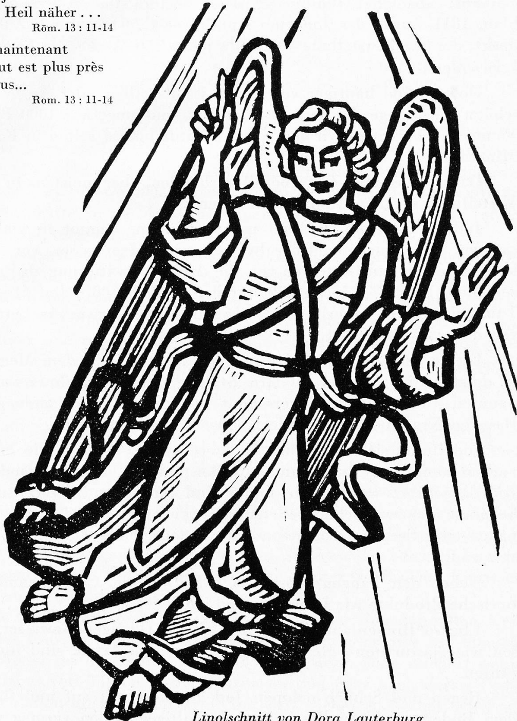
Linolschnitt von Dora Lauterburg