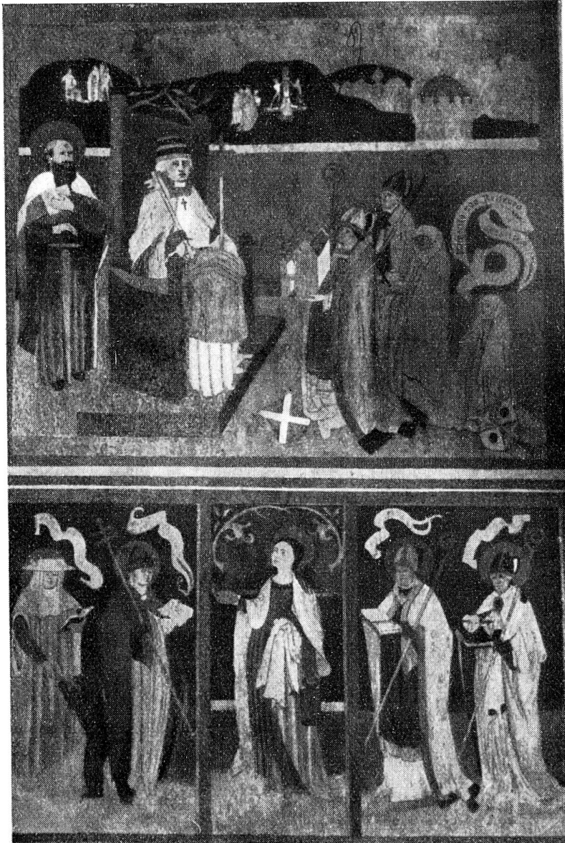
Abb. 2. Klosterkirche Cazis. — Malerei an der Südwand des Chores. Von 1504.

weiblichen Heiligen in der Mitte. In der Linken trägt sie eine Weinkanne, und was ihre Rechte hält, wurde bei der Restaurierung als Lampe rekonstruiert. Doch scheint es mir wahrschein-