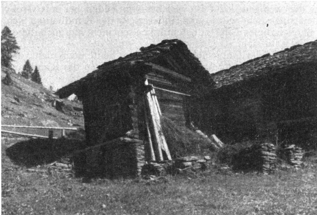
Abb. 1. Schlafhaus im Monte Valbella (Calanca, Kt. Graubünden). Fast quadratischer Kantholzblock mit stark ausladendem Pfettendach. Der gemauerte Unterbau dient als Keller. An der Traufseite findet sich die Türe, erreichbar über eine kleine Laube. An der Giebelseite bemerkt man die kleinen Fensterlucken, sowie Reste eines Trockengestells.

Durch Zufall stießen wir im Val Calanca (Kt. Graubünden) auf zahlreichen Maiensässen (Monti genannt) neben den üblichen Wohn- und Wirtschaftsgebäuden auf kleine, unscheinbare Blockbauten. Ein Blick durch die unverschlossenen Türen oder durch die kleinen, aus einem Balken herausgeschnittenen Fenster ins Innere ließ einen einfachen Schlafraum erkennen (Abb. 1).