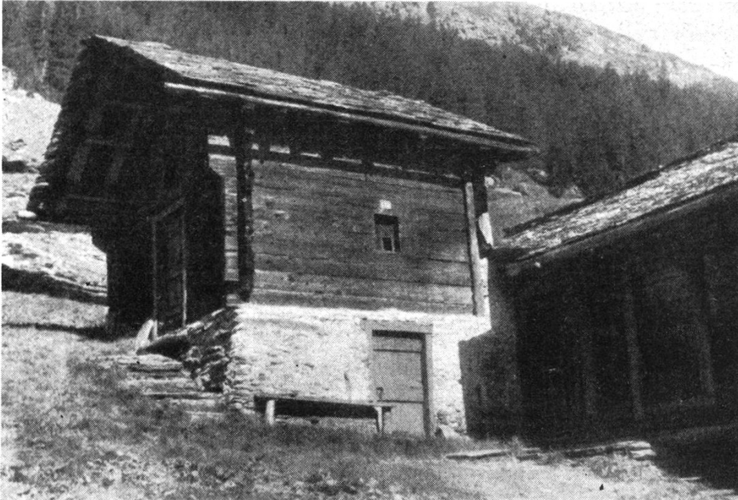
Abb. 3. Neueres Schlafhaus in Valbella. Der ursprüngliche Habitus ist gewahrt, auch das weit vorgezogene Dach fehlt nicht. Der Unterbau enthält einen Milchkeller. Der Herdraum befindet sich im quer dazu stehenden Wirtschaftsbau (Heustall mit Wohnküche).

Als Ortsname kommt die Bezeichnung «Schlafhäusern» bei Steffisburg (Kt. Bern) vor; vielleicht findet man ihn auch anderswo. Es ist allen Lesern bekannt, daß im Mittelland noch heute in zahlreichen Speichern einzelne Kammern als Schlafgemache gebraucht werden. Dies erklärt, warum oft der Ausdruck «Schlofhus» auf solche Speicher übergegangen ist. Der zitierte Ortsname verdankt sicher diesen Verhältnissen seinen Ursprung.