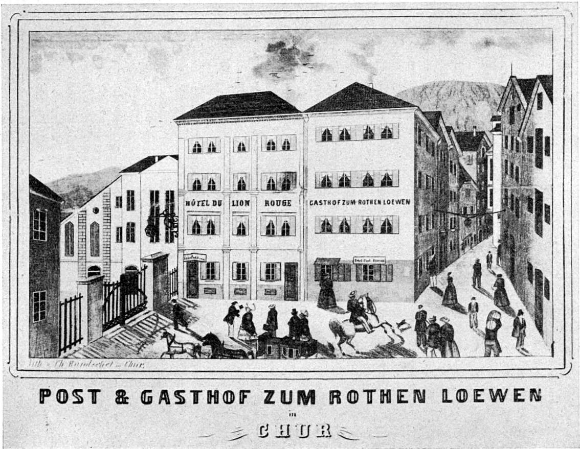
POST & GASTHOF ZUM ROTHEN LOEWEN in CHUR