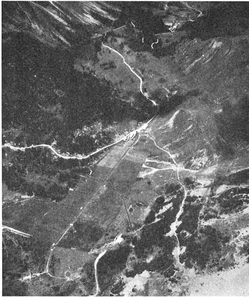
Aufnahme Crap alv vom 23. 7. 1952, 11.21 h durch Militärflugdienst. Maßstab 1:50 000. Blick Ost-West.

Beachte: Links unten: Kanalisierung des «ovel d'L'Ervedi». Mitte: Entwässerungskanal mit Seitenkanälen, Wiesparzellen zum Teil gemäht, zum Teil in Rodungsbearbeitung. Die Abzäunung des Neu-Wieslandes gegen das Weidland hin ist deutlich erkennbar. Oben Mitte: Preda ist erkennbar. Links südlich davon Palpuogna, darob, bildlich südlich die Weidewiesen von Weißenstein.