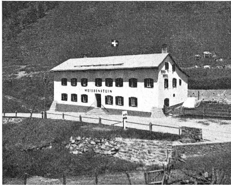
Haus Weißenstein am Albula – Crap alv Aufnahme 1953

auf Weißenstein in einer gar unwirtlichen Höhe von über 2000 Meter über Meer den Grundstein für eine Zukunft legte.