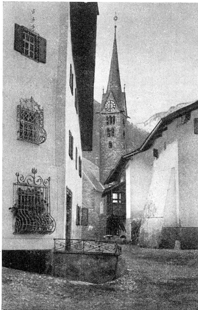
Kirchgasse mit Kirchturm

Des Pfarrers Lanz die Töchterlein, ade mit vier Brot eilten hinterdrein, ade und in der Cuort des Not Ambiel ein ganzer Käs, das war zu viel, ade, ade.