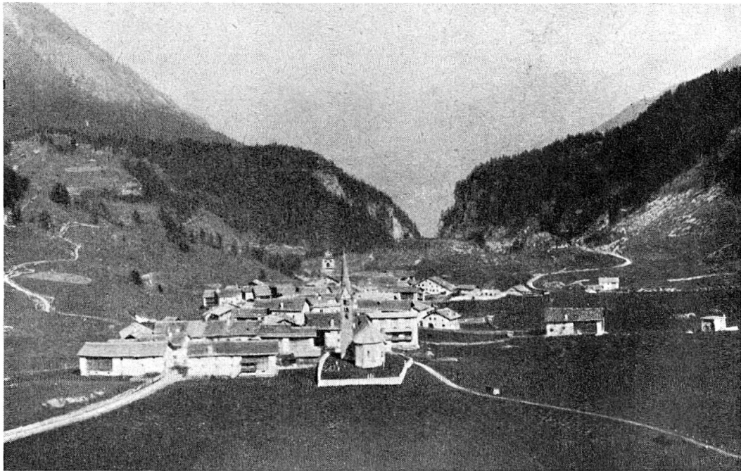
Bravuogn/Bergün vor dem Brande 1892

der ersten Liebe heil'ger Ort, Erinnerung so traut. Und das ist meines Vaters Grund und meiner Lieben all, und alles findet jeder Stund im Herzen Wiederhall, und alles ruft die Jugendzeit mir jubelnd in den Sinn, in allem was da weit und breit ist eine Seele drin. Und ist der Boden noch so arm und mager sein Ertrag, und wär' die Fremde noch so warm, ich doch nicht gehen mag, denn dich nur lieb' ich, Heimat mein, wie nichts sonst in der Rund'. Hier laßt mich ruh'n, hier laßt mich sein, im lieben Heimatgrund.