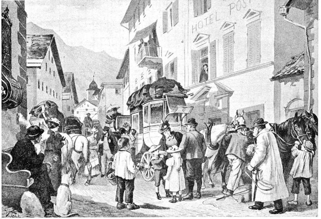
Alvapist vor dem Hotel Piz Ela