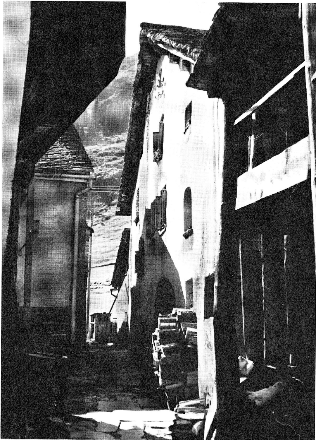
In einer der engen Gassen Hinterrheins steht das «Tachlihus»