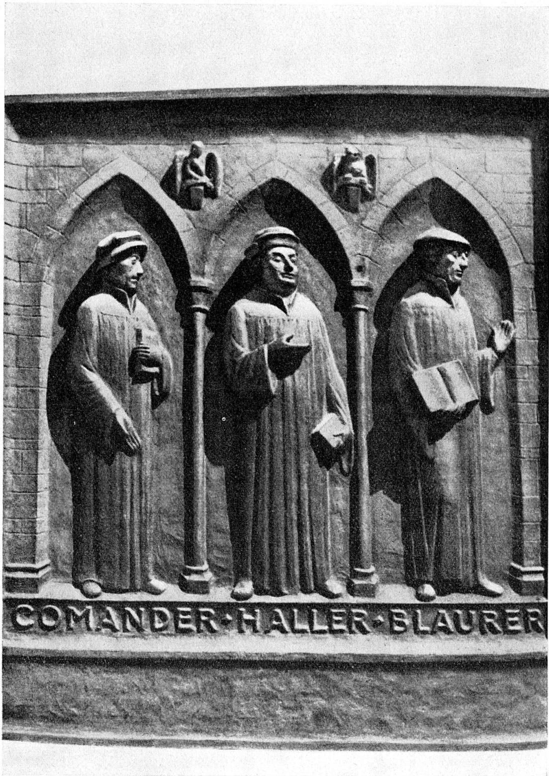
Großmünster Zürich: Am Südportal