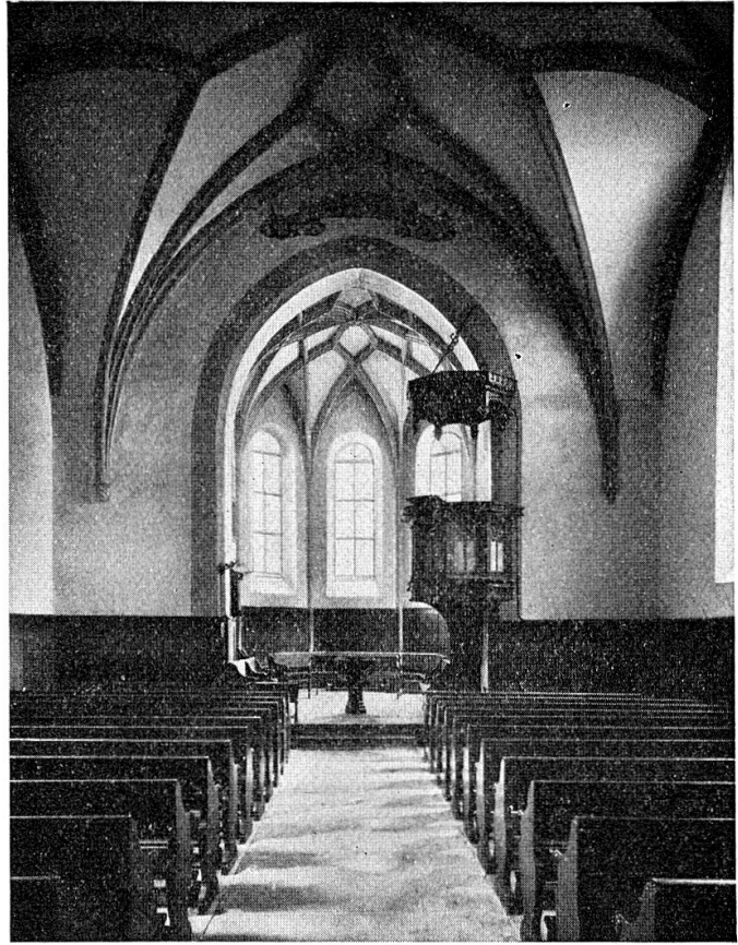
Regulakirche (gegen Chor)

Aus «Kunstdenkmäler der Schweiz», Kanton Graubünden, Band VII, Basel