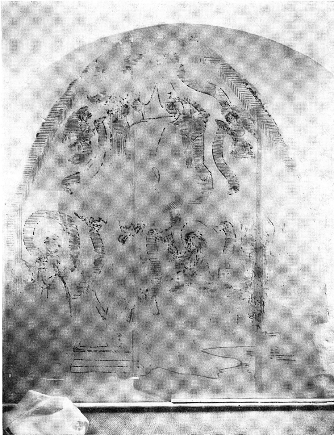
Trimmis, katholische Pfarrkirche, Wandbildfragment, Befund.