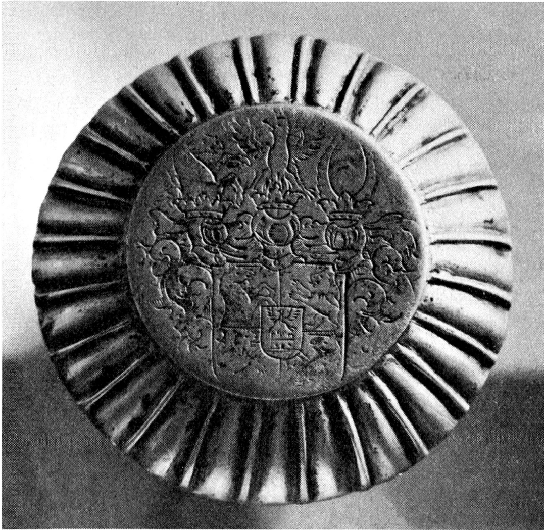
Knauffläche eines Gerichtsstabes von Lugnez.