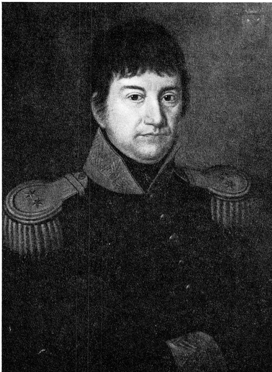
General Jakob Sprecher von Bernegg Kommandant und Inhaber des Regimentes Nr. 31, 1814 bis 1822