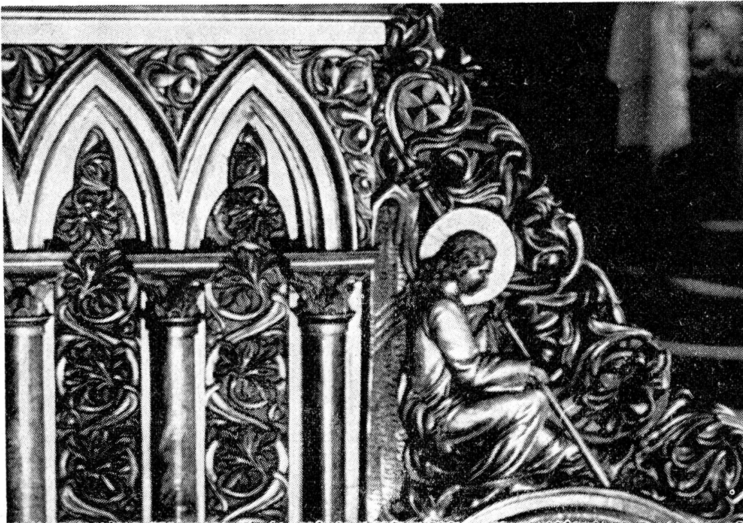
Kathedrale Chur. Pontifikalthron, 1883, Brüstung zum Chorgestühl von C. Aufdermaur und Söhne.

1883 bauen die Gebrüder Albin in Medels den neugotischen Pontifikalthron, 23 das Prachtsstück der neugotischen Disposition. Die plastischen Teile (am Betpult und an der Brüstung) wurden von C. Aufdermaur und zwei Söhnen ausgeführt. 24 Damit erhielten beide Teile des spätgotischen Chorgestühls nach Osten hin einen gleichwertigen, überhöhten Abschluss, auf der Südseite mit der Chororgel (besonders mit der späteren in den kleineren Ausmassen), auf der Nordseite mit dem Bischofsthron. Und in der Achse als Höhepunkt – vom spätgotisch-