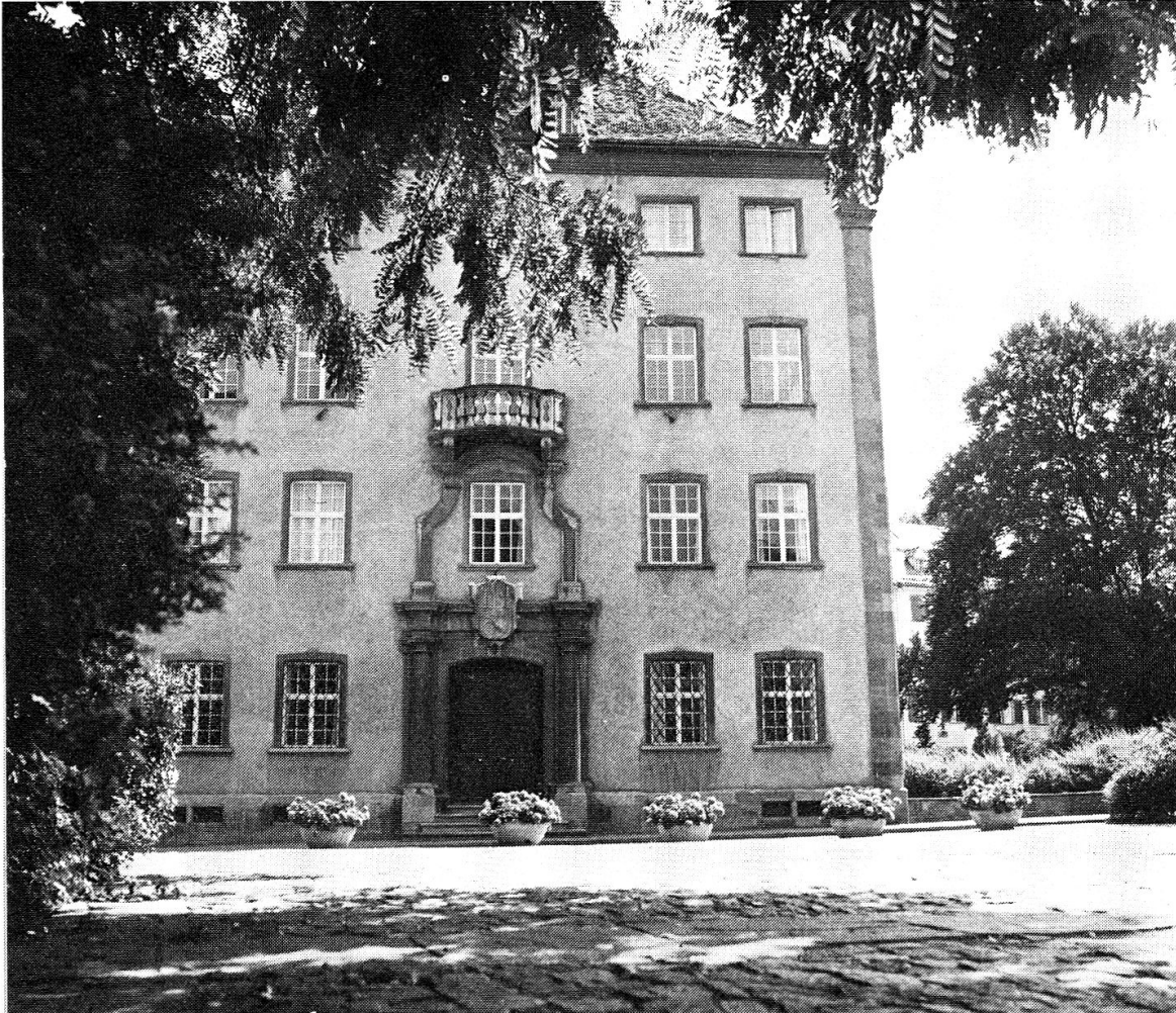
Regierungsgebäude des Kantons Graubünden (Graues Haus). (Salis-Palast 1751 erbaut, 1807 vom Kanton gekauft).

der bisherige Waffenplatz erhalten bleibe und wo möglich weitere Entwicklung erfahre, um der mit einem solchen Institut verbundenen Vorteile willen sowohl für das ganze Land, als für die nächstliegende Gegend insbesondere.