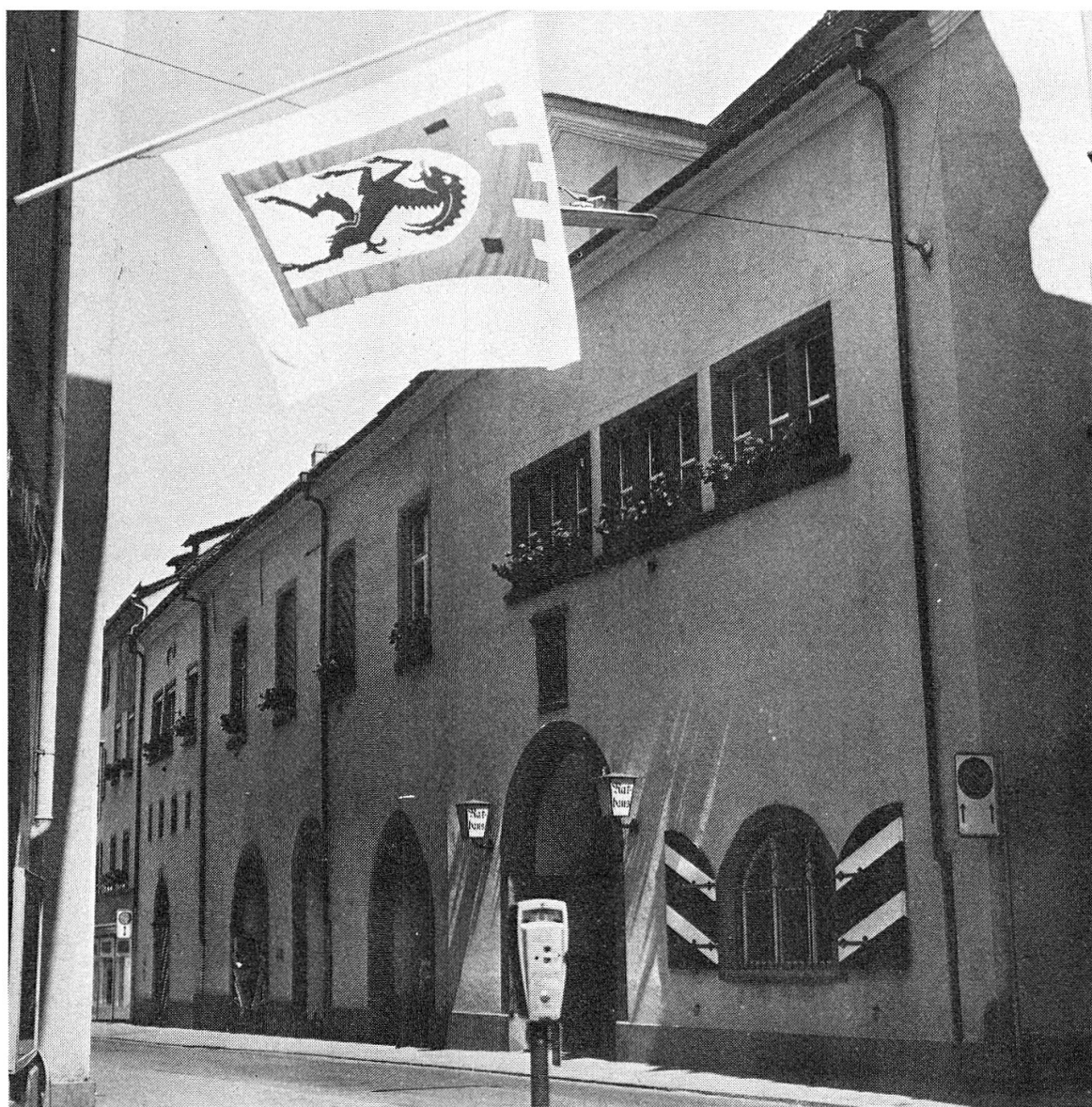
Rathaus der Stadtgemeinde Chur (aus dem 15. Jahrhundert, stilgerecht renoviert).

weise ausgleichen. Entschädigungsansätze des Bundes seien in Aussicht gestellt worden, und die Vermehrung der militärischen Kurse sowie der Ausbau der Bundesbahnen würden Mehreinnahmen sichern. Die Benützung des Waffenplatzes durch den Bund während zehn Jahren sei garantiert. Angesichts der Bedeutung von Chur an der Südostgrenze sei es unbedingt nötig, an diesem Standort festzuhalten. Für die Stadtkasse entstehe zwar kein gutes finanzielles Geschäft, doch bringe es andere Vorteile mit sich, nämlich gemäss grossrätlichem Ausschreiben zur Volksabstimmung: