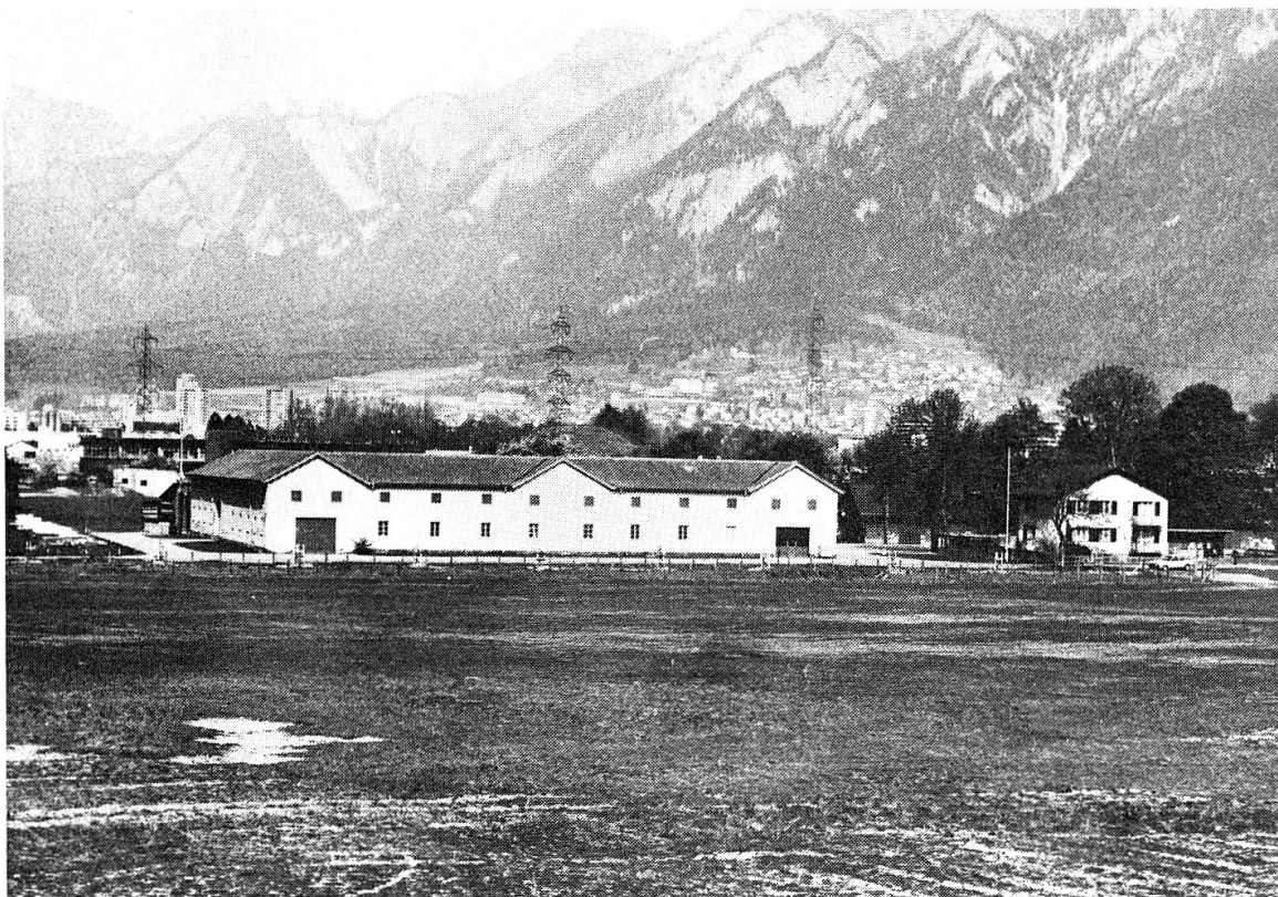
Alte Kaserne, 1818/20 erbaut.

1818–1820 liess die Stadtgemeinde Chur eine Kaserne auf dem schon damals sogenannten Rossboden bauen und gleichzeitig die Ebene am rechten Rheinufer als Exerzier- und Gewehrschiessplatz ausbauen. 1839/40 fanden der Ankauf des Rossbodens und der Kaserne durch den Kanton statt. Chur überliess dem Kanton den grössten Teil des Rossbodens zu einem Lager-, Übungs-, Exerzier- und Musterungsplatz sowie den Platz in der Au als Schiessstand für die Dauer von 50 Jahren. Die Kaserne konnte 1841 bezogen werden. Die alte Kaserne dient jetzt als Zeughaus. 3