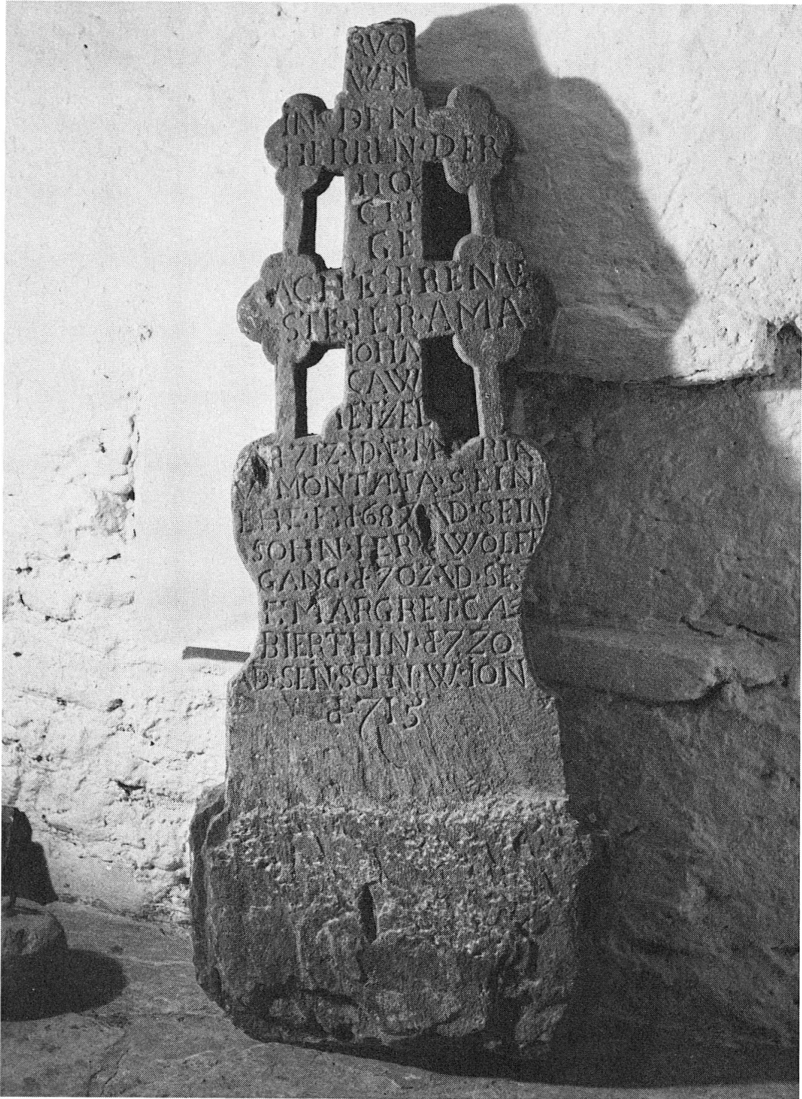
Abb. 2. Hinterseite des Tomilser Steinkreuzes.