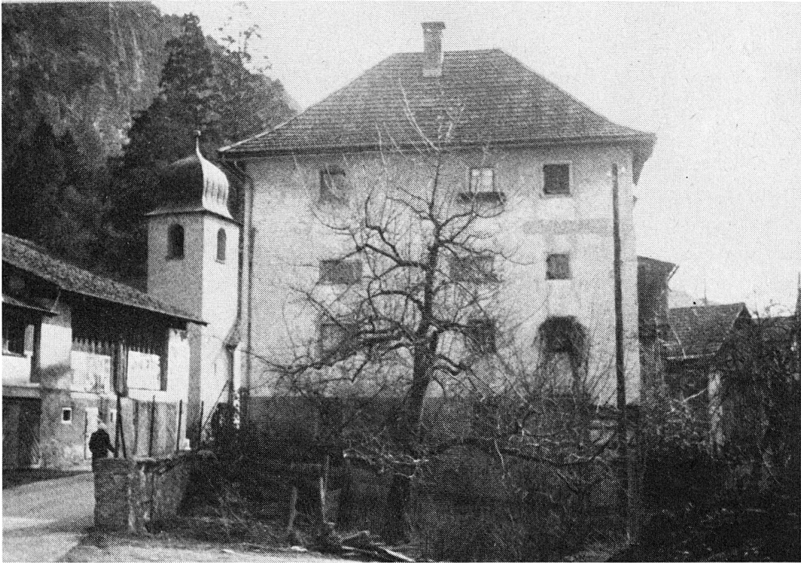
Abb. 3. Das 1734–35 erbaute ehemalige Haus Flisch und die 1740 erbaute Kirche am nördlichen Dorfeingang von Rothenbrunnen.