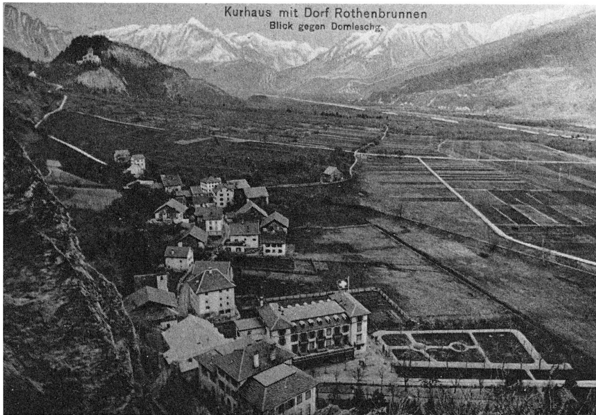
Kurhaus mit Dorf Rothenbrunnen um 1900