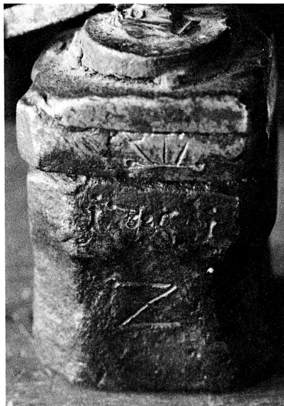
Gewicht einer Hebewaage von 1646, ältestes Datum auf der andern Seite.