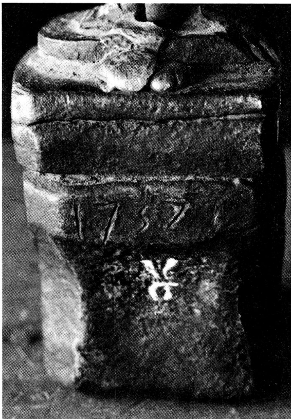
Gewicht einer Heuwaage 1646. Zeichen Rübe.