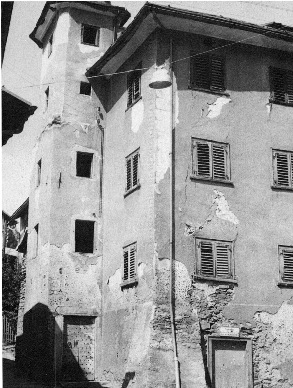
Das «Türali»-Herrschaftshaus in Valendas ist auch ein Marchion-Gebäude und sollte restauriert werden.