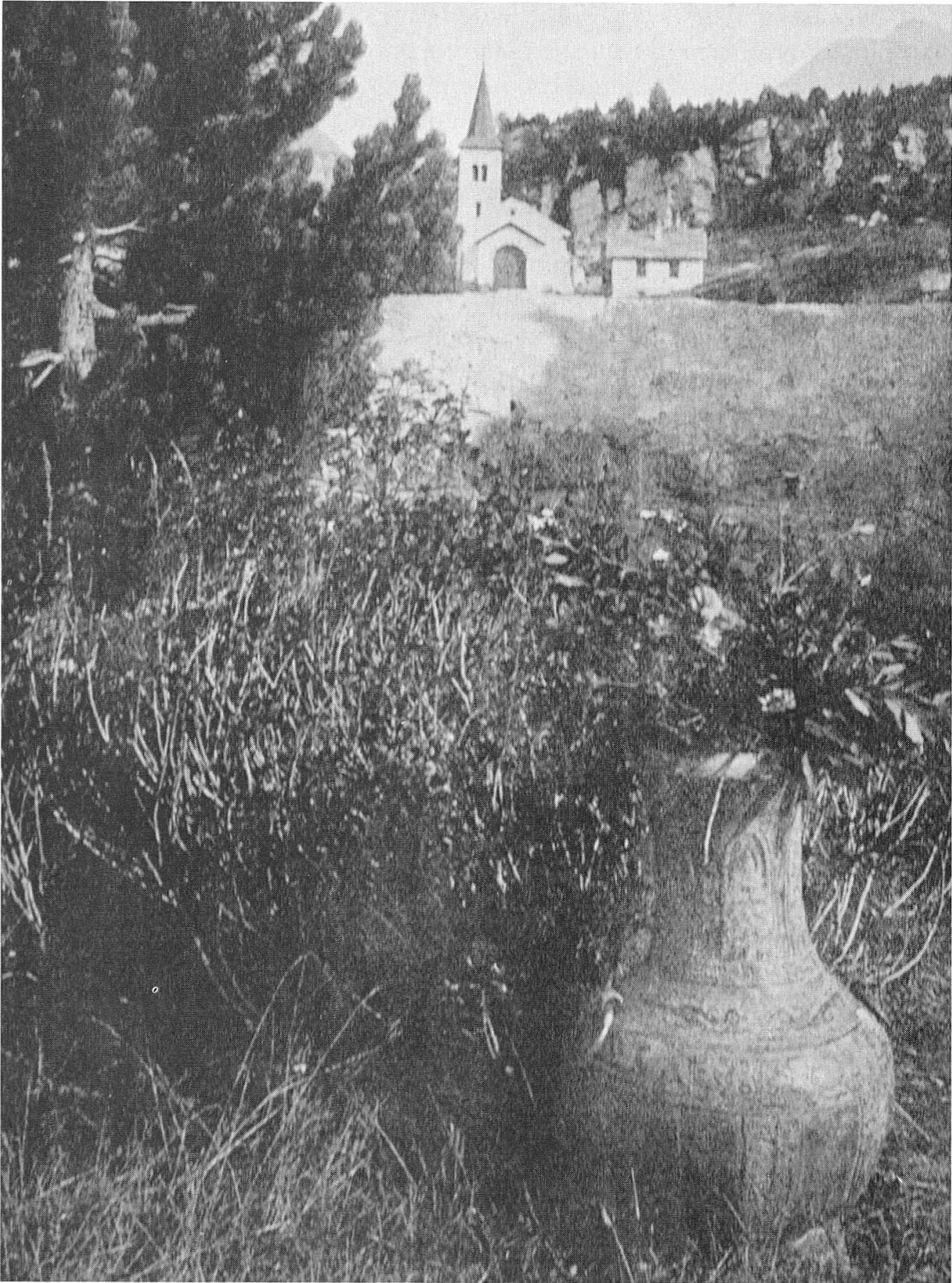
Das Grab Segantinis in Maloja