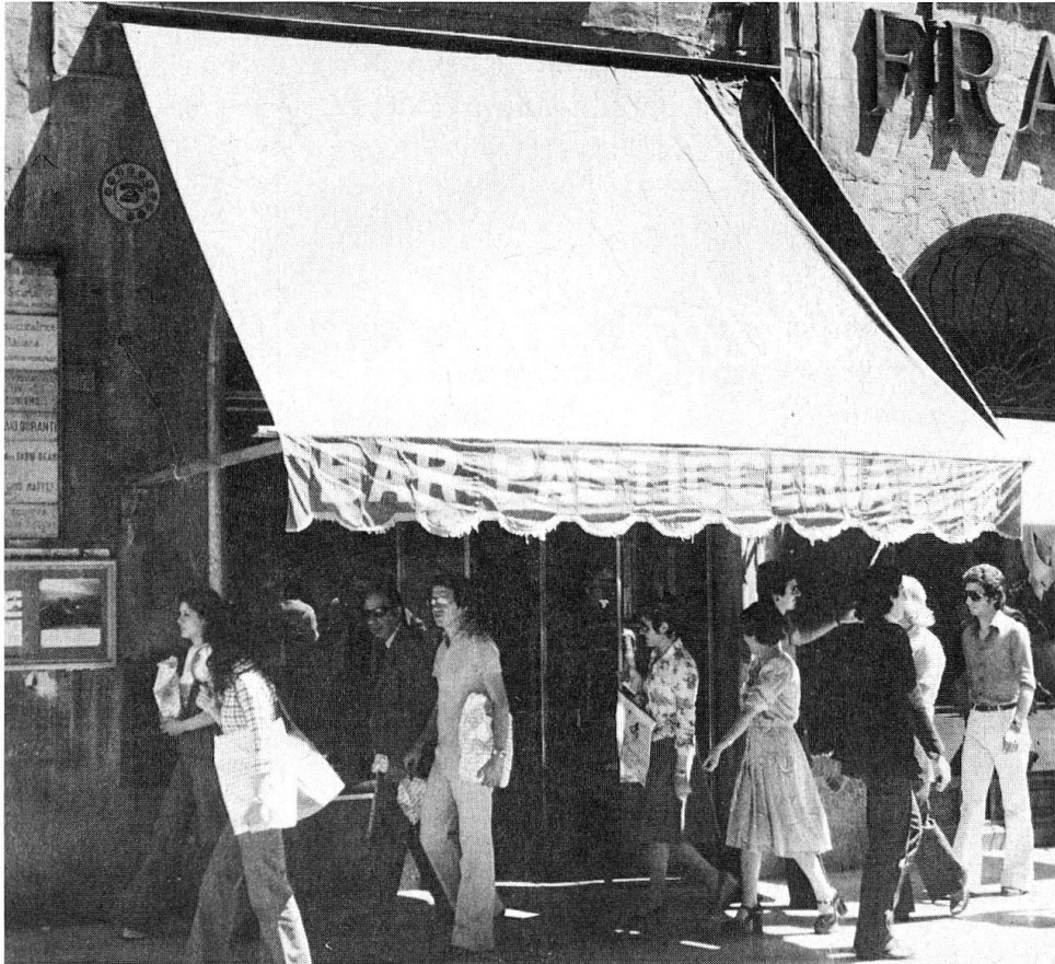
«Pasticceria Sandri» am Corso Vanucci in Perugia um 1975.

Zuckerbäcker aus dem Safiental lassen sich in der zweiten Hälfte des letzten Jahrhunderts in über 30 Städten der kaiserlich-königlichen österreichisch-ungarischen Monarchie nachweisen!