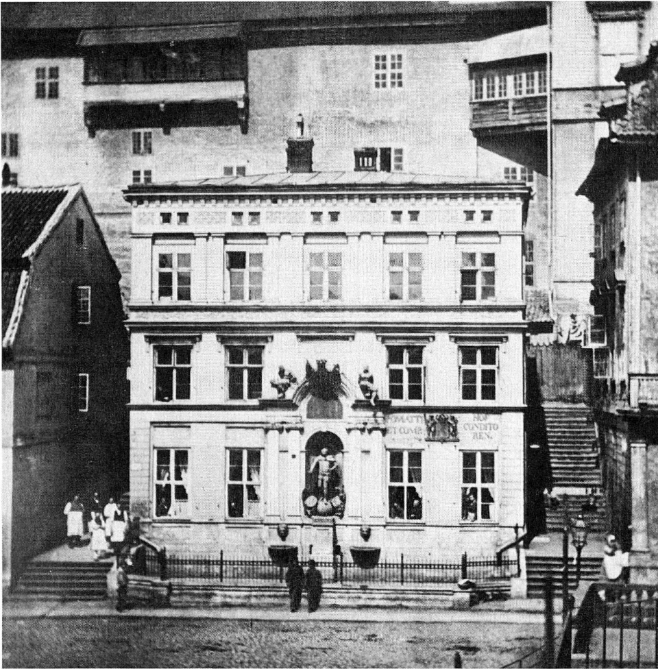
«Conditorei Pomatti» im alten Poshaus des königlichen Schlosses zu Königsberg um 1890.

Frizzoni, Orlandi, Bosio und weiterer Kaufleute und Zuckerbäcker zu sehen. Paläste, die mit dem in der Fremde erworbenen Vermögen in heimischen Gefilden errichtet wurden.