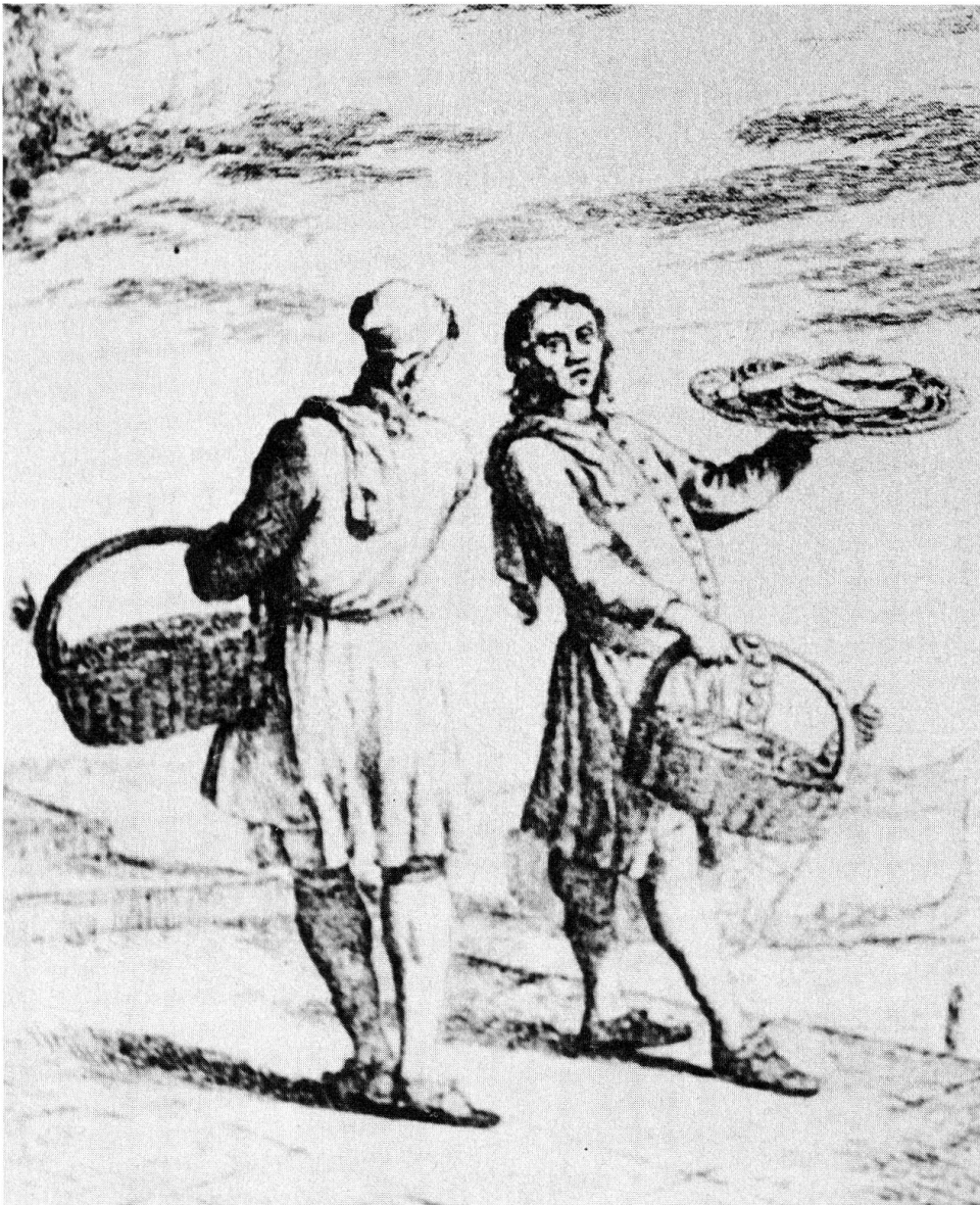
Zuckerbäcker. Auswanderung war durch die neue Ernährungs- situation nicht mehr lebensnot- wendig.

Oft wurden fettige und schwerverdauliche Mahlzeiten – wie etwa Holdermus – im Volk als gesund und kräftebildend betrachtet. 23 Wieweit diese Ansicht noch heutzutage verbreitet ist, gerade auf Kartoffelgerichte bezogen, scheint schwierig zu beurteilen.