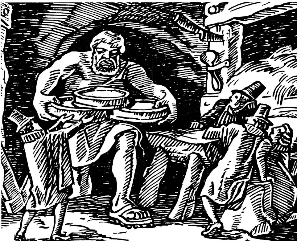
Grosse und starke Bündner. Früher als Idealvorstellung in Sagen, heute als Realität durch neue Ernährung.

Sehr grosse Bedeutung darf den Konservierungsmethoden zugesprochen werden, die in späteren Jahrzehnten angewendet wurden. Teuteberg und Wiegelmann sprechen sogar vom «Aufbruch des Konservierungszeitalters», 20 «das nicht zufällig mit dem Anfang der Industrialisierung zusammenfällt.» 21 Obwohl das Einmachen oder Sterilisieren bei der Kartoffel keine grosse Rolle spielt, darf nicht übersehen werden, dass das Trocknen oder Dörren, wie es noch im Neuen Sammler heisst, grosse Wichtigkeit erlangte. Man denke nur etwa an Produkte wie Kartoffelstock usw., die aus Kartoffelpulver hergestellt werden können.