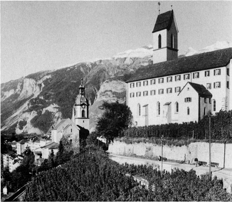
Bistum Chur: Viele Rebberge wurden zu Kar- toffeläckern.

volkskundlicher Sicht – neben der kommunikativen Wirkung auch magische Wirkung zukam und -kommt, kann hier nicht behandelt und beantwortet werden. Doch sollte in diesem Zusammenhang sowohl der sprachlichen Grussveränderungen, wie auch der Veränderung der Gestik Beachtung geschenkt werden. Diese Kurzkommunikationen oder Verbindungskommunikationen zu längeren Gesprächen beinhalten recht interessante Hinweise über Lebenseinstellung, Existenz usw. So sagt man etwa im Unterengadin: «vaina sü bella?/ kommen schöne (Kartoffeln aus dem Boden)?,» 32 oder in Breil «va 'i vinavon?/ geht es vorwärts?» 33 In Falera spricht man von «caveis truffels?/ grabt ihr Kartoffeln?» 34 In Ardez und Tschier sagt man: «reda (redi) bain?/ gibt es gut aus?» 35 und in Vaz «betg bi samazza/ nur langsam (töte dich nicht gerade).» 36 Oft kommen in diesen Kommunikationsformen, die manchmal struktur- und inhaltsmässig den Kommunikationsformen über das Wetter ähneln, Spässe vor, die vermutlich die oberflächliche Kurzkommunikation vertiefen und auflockern. Im Engadin und im Münstertal spasst man, nachdem man gefragt hat, wie die Ernte aussieht: «i vegn ora mailinterra sco crappa/ es kommen (soviel) Kartoffeln zum Vorschein wie Steine.» 37 Manchmal, wenn die Kartoffeln sehr klein sind, spricht man auch von «crastognas/ Kastanien» oder von «frosclas, frosramenta, froslerverc/ Hagebutten.» 38