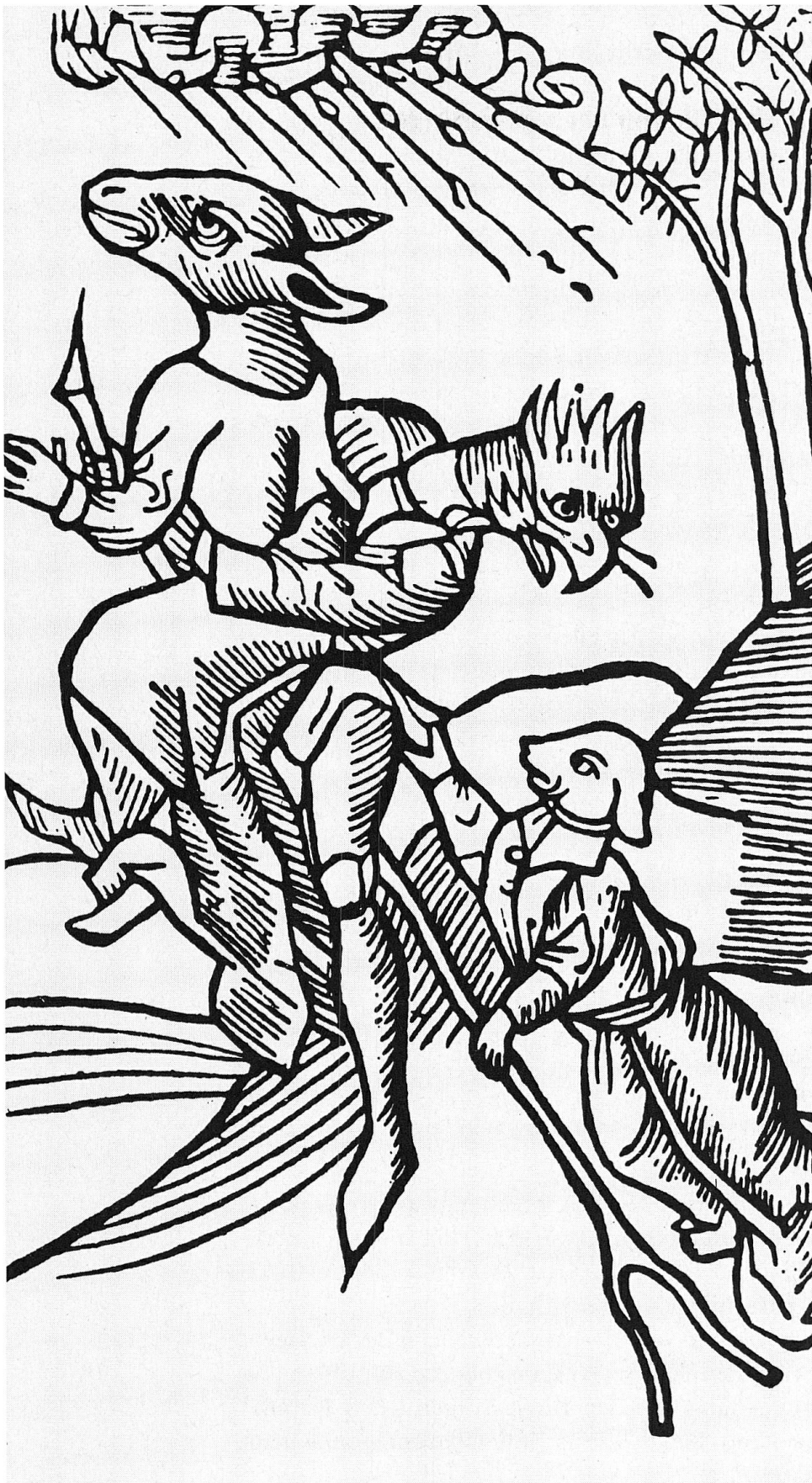
Abb. 2 Nach der Volks- meinung können sich Hexen in Tiere verwandeln.