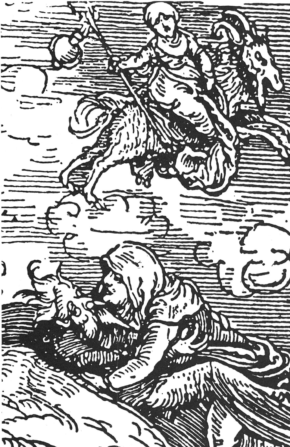
Abb. 1: Teufelsbuhlschaft und Hexenritt, Holzschnitt um 1520.