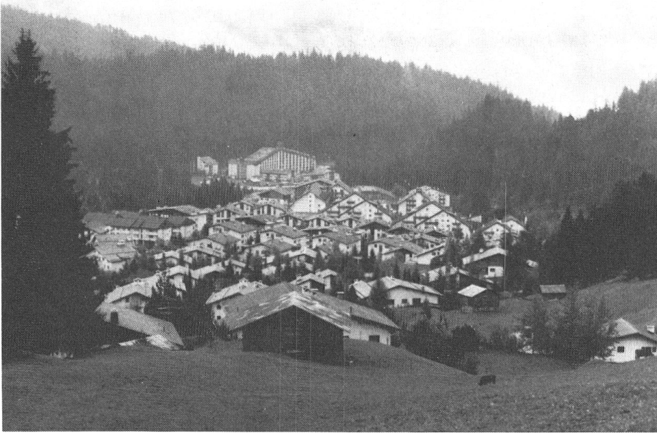
Abb. 4: Ein modernes Feriendorf aus den sechziger und siebziger Jahren (Laax- Murschetg).