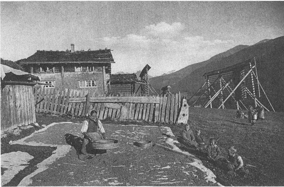
Abb. 1: Leinverarbeitung im Tavetsch, Jahr- hundertwende.