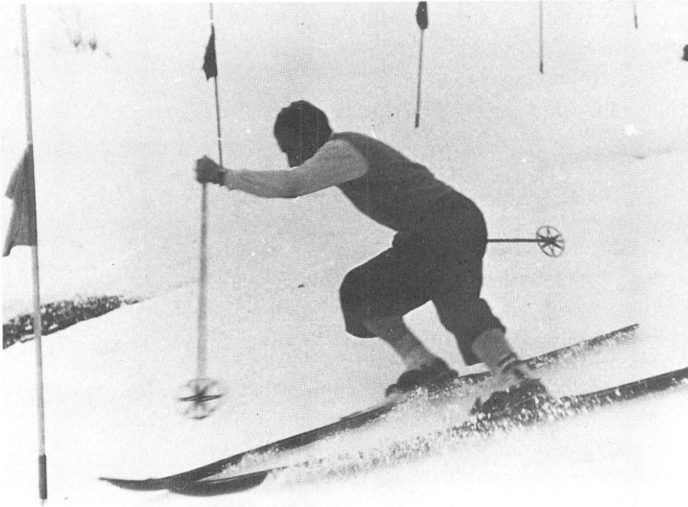
Abb. 5: David Zogg, 1934 Weltmeister in Abfahrt und Kom- bination.