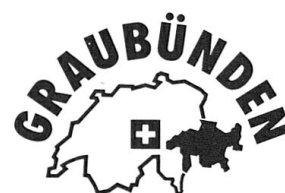
Die Ferienecke der Schweiz.