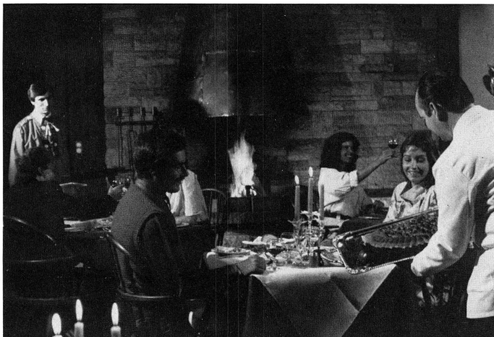
Abb. 3: Der Einsatz von Saisonarbeits- kräften ist eine Voraussetzung für die Funktionsfä- higkeit der Bünd- ner Wirtschaft.

Teilweise können die Saisonschwankungen mit Erwerbskombinationen oder Teilzeitbeschäftigungen aufgefangen werden. Daneben ist aber der Einsatz zahlreicher, vor allem ausländischer, Saisonarbeitskräfte eine unabdingbare Voraussetzung für die Funktionsfähigkeit der Bündner Wirtschaft und damit auch für die Sicherung der Erwerbsmöglichkeiten für die einheimischen Arbeitskräfte.