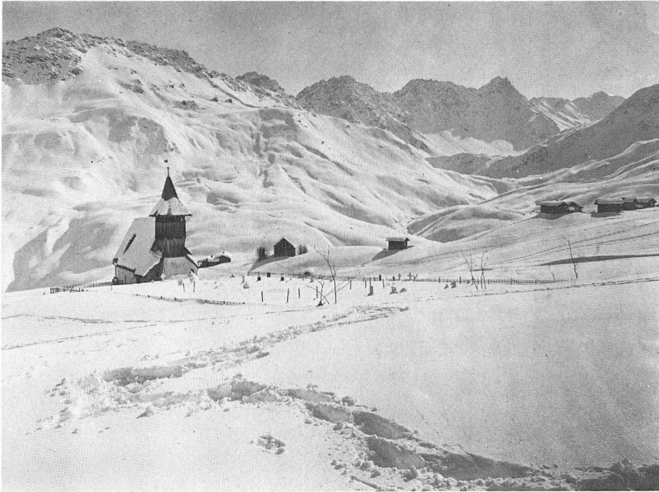
Abb. 2: Inner-Arosa, 1908. Landschaft mit Kirche, Wohn- häusern und Stall- scheunen.

Der kritischere Schluss des Zitats spricht die Lebensverhältnisse der «zufriedenen Bewohner» an. Und die waren, wie die medizinhistorische Dissertation von Walter Caviezel zu den hygienischen Verhältnissen im vortouristischen Arosa aufzeigt, 8 ausserordentlich primitiv. Im folgenden soll anhand dieser Untersuchung versucht werden, der romantischen Verklärung die reale Wohnsituation gegenüberzustellen.