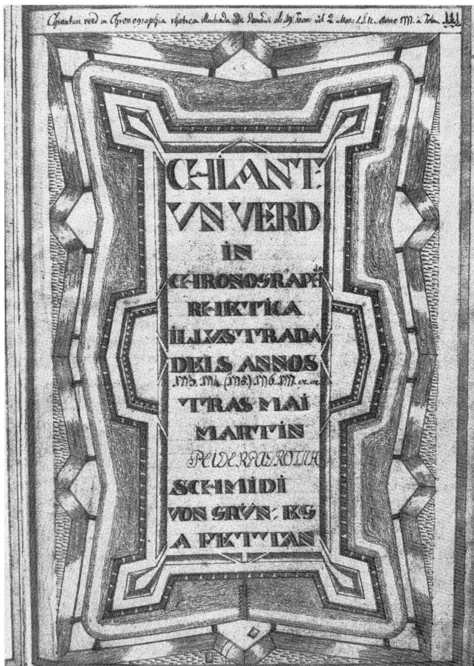
Abb. 2: Titelblatt des Chiantun verd.

einem Tanzmeister, das Fechten, Musik bei einem «Violin-Musica maister», Konversation, Mathematik, Trigonometrie, Billard, Spiele aller Art» . . . um nicht weniger zu gelten als andere – «per non esser main dels auters.»