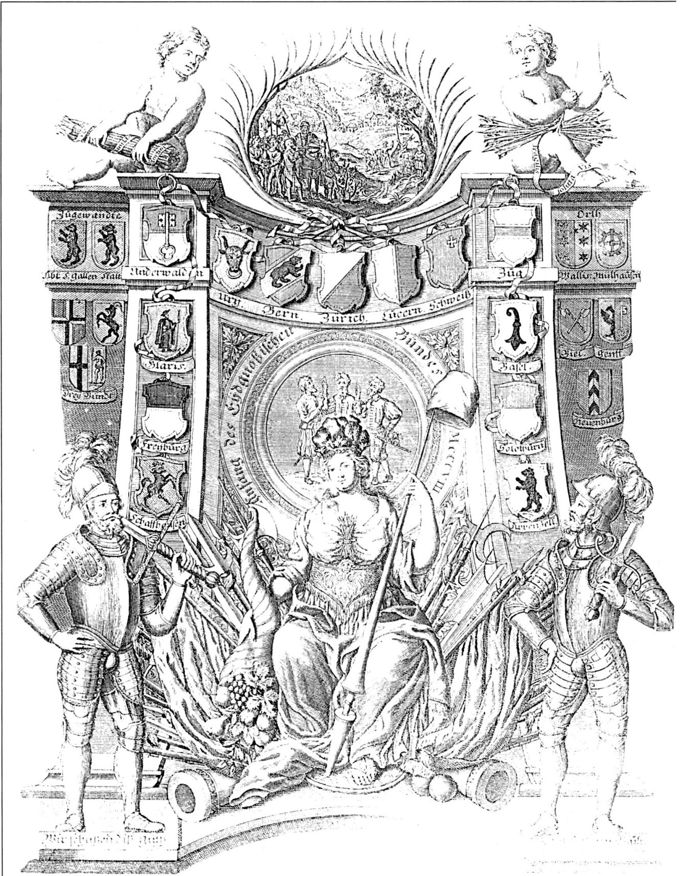
«Vorbild Eidgenossenschaft» (Friedrich Pieth).