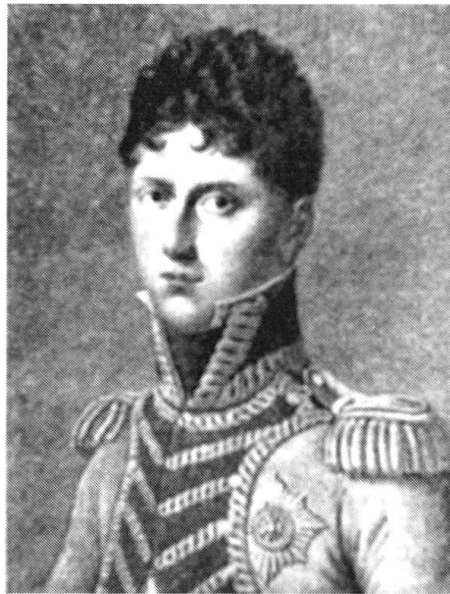
Abb. 3: König Wilhelm I. von Württemberg (1781–1864). Nach der Natur gezeichnet und gestochen von Müller (Kgl. Kup- ferstichkabinett Stuttgart).

kehren. Von Mailand ging's diesmal an den Lago Maggiore, wo man selbstverständlich den Borromäischen Inseln einen Besuch abstattete. Über Varese gelangte die Gesellschaft dann nach Como: «Hier erfahren wir, dass der König, der über den Bernhardin gehen wollte, schon bis über Bellinzona gekommen, wieder umkehren musste, weil der Weg durch fürchterliche Gewitterregen verdorben war, und drum nach Como zurück ging und nach einigen Stunden dasselbe verlassen hatte. Am 28. August hielten sich die Württemberger einmal mehr in Varenna auf, wo sie die Mitteilung erhielten, wegen eines Unwetters sei auch der Splügen nicht passierbar: «Auf dem Splügen war bei Giacomo der halbe Berg mit der Strasse eingerissen worden, einige Menschen sind umgekommen, und nach [. . .] ist bei Sondrio dasselbe geschehen. Beiläufig gesagt, unser Fourgon war bei einem heftigen Sturm auf dem See und wäre um ein Haar mit allen unseren Effekten eine Beute der Wellen geworden. Ich danke Gott, dass kein Unglück geschehen und wir nun alle hier versammelt sind. Diese Verspätung wird aber Alarm nach Stuttgart bringen, besonders wenn man schaut, was geschehen ist und die Stafette zu Fuss so nicht vermag, den Splügen zu passieren, um dort die Ursachen des Nichteintreffens zu sagen.» Deshalb beschloss man alsogleich, in weitem Bogen auszuweichen und kehrte dann via Bergamo – Verona – Brixen – Innsbruck – Kempten – Ulm nach Stuttgart zurück, wo die Reisegruppe am 4. September 1834 eintraf.