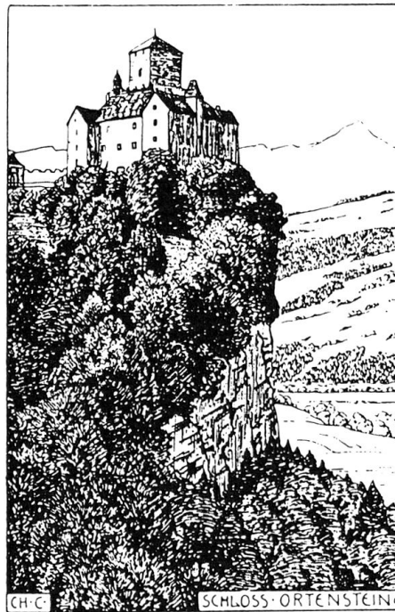
Abb. 2: Schloss Orten- stein. Federzeichnung von Christian Conradin.

den, eleganten Rappen ritt eine junge Dame, die vornehme Figur in die gutkleidende Amazone gehüllt. Ihr zur Seite umspannte mit leichtgebogenen Leinen der Reiterin höchsteigener Vetter den etwas allzu breiten Rücken eines norddeutschen Schlachtenhengstes. Es folgte auf einer breitbeinigen Ungarstute der Amazone jugendlicher Bruder, einige Dutzend Cigarren und eine geschwollene Wange als Handgepäck mit sich führend. Den Schluss bildete ein leichter Wagen mit den nötigsten Effekten für Mann und Pferd, gelenkt von Andrea, des Hauses bewährtem Diener.