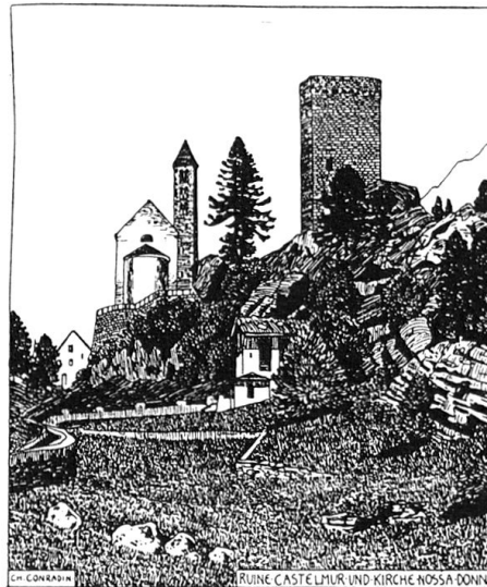
Abb. 3: Ruine Castelmur und Kirche Nossa Donna. Federzeichnung von Christian Conradin.

Marie-Antoinette»; ob die Pariser sich nicht über dieser «Avenue» erstaunt hätten? Hoch oben auf einem Felsenkopf steht das in einem etwas merkwürdigen Stil erbaute Schloss des Grafen Renesse, des Gönners und Förderers des Kurortes. Leider erlaubten es die bald leeren Kassen des Grafen nicht mehr, das Schloss einzurichten, und so blieb es, um seinen Erbauer nicht zu überholen, auch leer, sich tröstend mit der Aussicht auf das prächtige Bergell und eine bessere Zukunft.