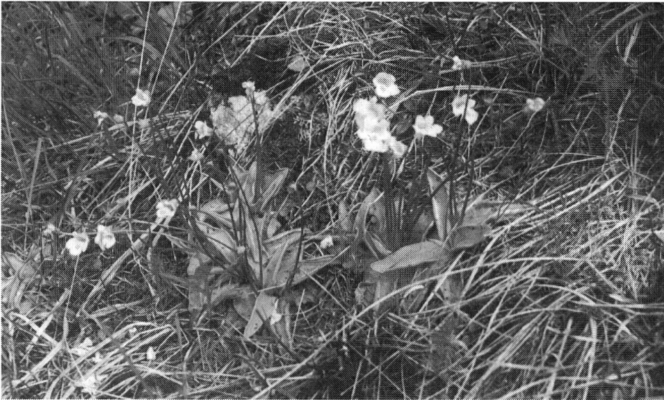
Fettblatt/ Pinguicula alpina