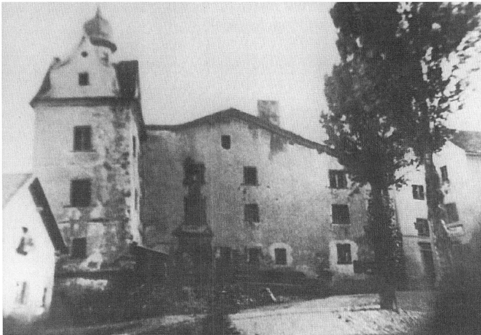
Das alte Rathaus in Ilanz, die Casa Grischa. In diesem Haus fanden die Sitzungen des Bundstages gemeiner Drei Bünde statt. Abgerissen 1881 aus: Leo Schmid / Alfons Maissen: Ilanz-Glion, 1977

Diesen Bund nannte man damals den «Bund des Oberen Teils» oder «Oberer Bund». Diese Bezeichnung behielt der Bund auch nach 1424. Der Name «Grauer Bund» bürgerte sich erst im Verlaufe des 15. Jahrhunderts ein. 42