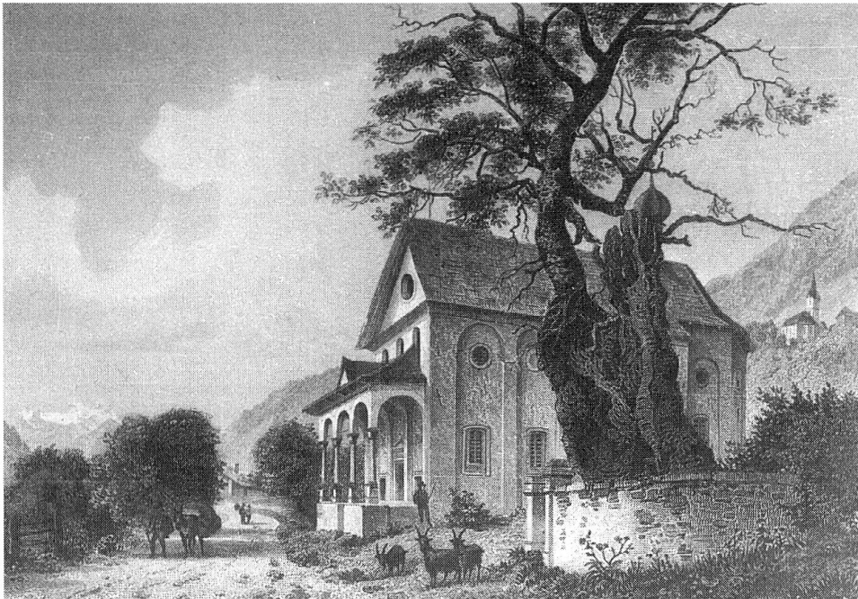
St. Annakapelle bei Truns