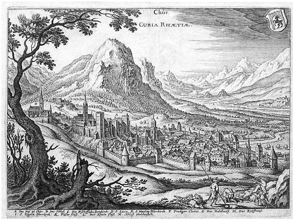
Stadtbefestigung mit Ringmauer und Türmen, um 1615 (Matthäus Merian).

vor der Stadt verwüstet wurde. Mit der Zeit verloren die Stadtmauern aber an Bedeutung, so dass 1797 der Deutsche Heinrich Ludwig Lehmann spöttisch vermerken konnte: «Und doch rühmen die Bündner von ihrer Hauptstadt: Sie sey unüberwindlich durch ihre baufälligen Stadtmauern, durch die Bauhaufen (Misthaufen) in den Strassen und durch die Mässigkeit ihrer Bewohner. Die Sturmleitern würden nicht befestigt werden können und die herunterfallenden Steine erschlugen die Grenadiere...» 2 Vor ihrem Abbruch, in der ersten Hälfte des 19. Jahrhunderts, war dann die Anlage in einem so bedenklichen Zustand, dass schliesslich ganze Mauerteile einstürzten.