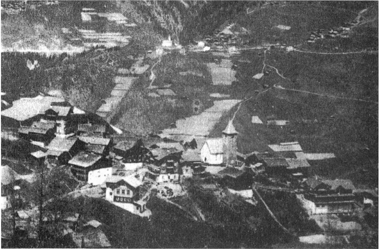
Äcker bei Castiel und Calfreisen, Ausschnitt einer Ansichtskarte, kurz nach 1900. Im Vordergrund Tschiertschen.

der Kartoffel nach 1770 wurde der Getreideanbau im Schanfigg – unter einer säkularen Optik betrachtet – sukzessive vom Kartoffelanbau verdrängt. 11 1917 wurden in Molinis lediglich noch 6 Prozent der gesamten Ackerfläche mit Getreide (ausschliesslich Sommergerste) bebaut, auf der restlichen Fläche gediehen Kartoffeln (Tabelle 2). Ähnlich sah die Lage in Praden (13 Prozent zu 87 Prozent), Tschiertschen (18 Prozent zu 80 Prozent) und Peist (20 Prozent zu 78 Prozent) aus. Die absolute Grösse des gesamten Ackerlandes dieser Dörfer scheint sich dabei im 19. Jahrhundert nicht verringert zu haben, die gesamte Ackerfläche (100 Prozent) ist flächenmässig durchaus auf das beginnende 19. Jahrhundert zu übertragen. 12