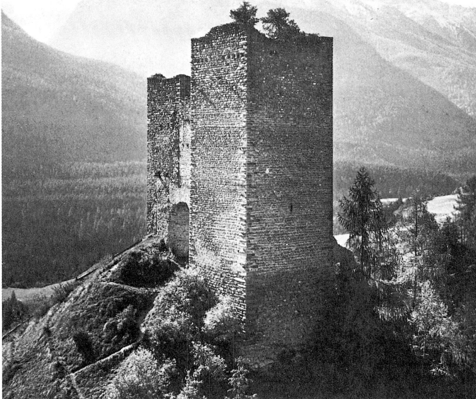
Die Burg Tschanüff in Ramosch, Vogteisitz des Hochstifts Chur

männer dagegen werden vom Landesherrn besoldet. Die Planta waren beispielsweise im 14. Jahrhundert Inhaber von Ammannschaft und Vizedominat im Oberengadin und genossen die aus der Besoldung des Ammanns und dem Lehen des Vizedominats fließenden Einkünfte. Die Art der «Entlohnung» der Churer Amtsvögte ist unbekannt, doch werden in anderen Landesherrschaften auch sie besoldet. Die Untersuchung dieser Frage gehört zu den zahlreichen Forschungsdesideraten zur Geschichte des Hochstifts Chur.