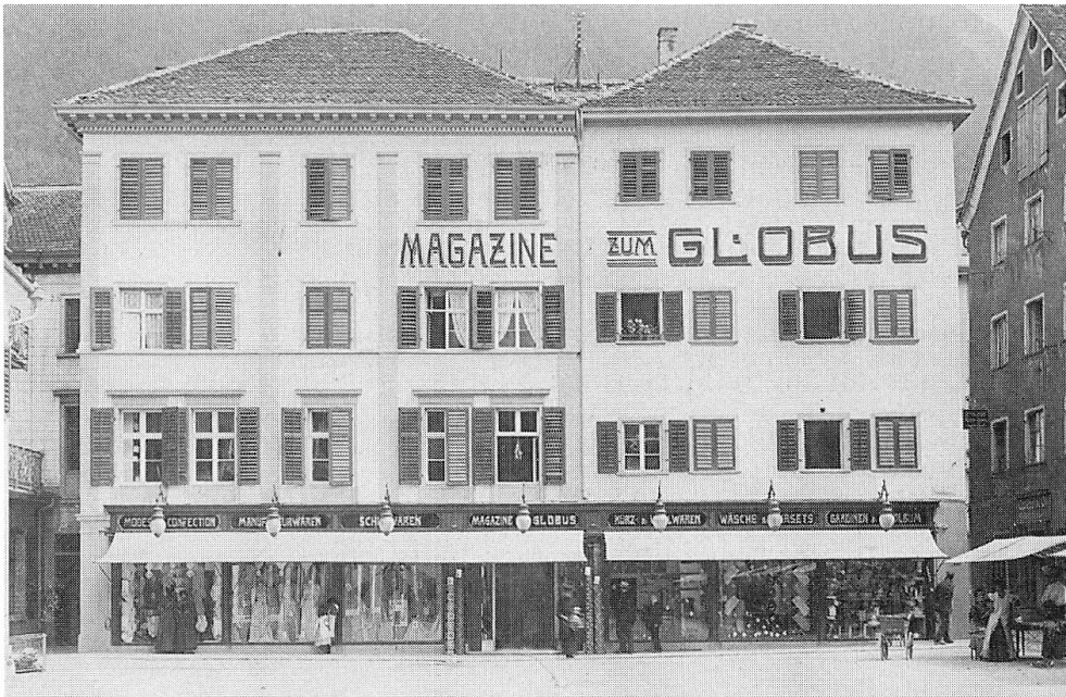
Abb. 9: Globus Chur, Aufnahme aus den Gründerjahren, um 1910. (Aus: Jubiläumschrift 75 Jahre Magazine zum Globus).

stände über eine sparsame Haushaltsführung mit zahlreichen Tipps für die Hausfrauen aufgebaut. 1956, im gleichen Jahr, in dem Bayer seine Milchbar eröffnete, zierte ein Plakat mit «Stop and Shop» das Gebäude; wieder ein Zeichen, dass die Amerikanisierung auch in Chur ihren Einzug hielt. 1965 verliess Globus den Kornplatz und zog an den Bahnhofplatz an den Ort, wo bis 1962 das grossartige Hotel Steinbock gestanden hatte.