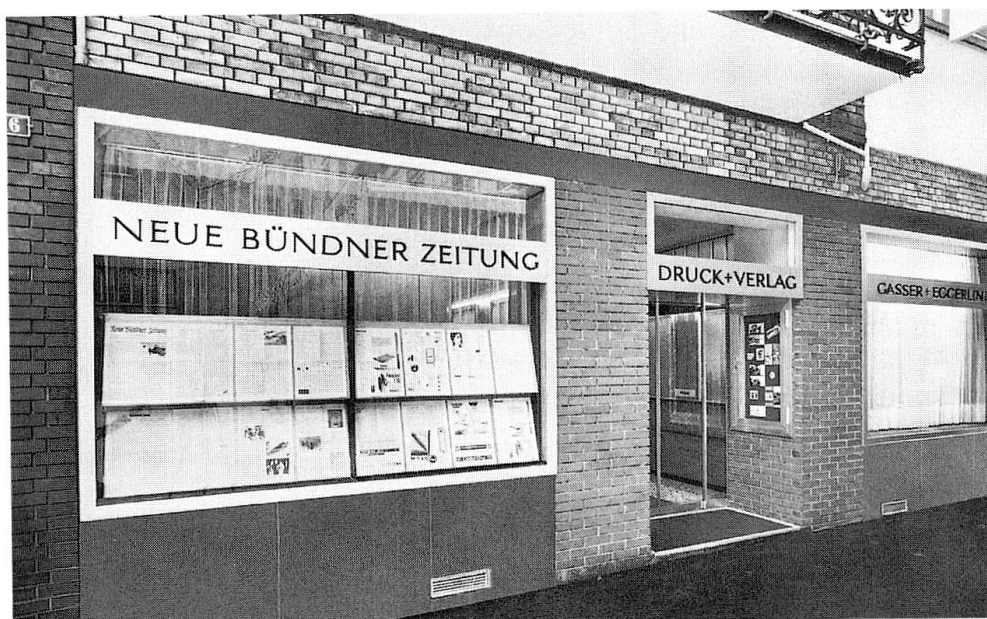
Abb. 2: Aussenansicht Druckereigebäude Gasser und Eggerling (heute Denner-Eingang).