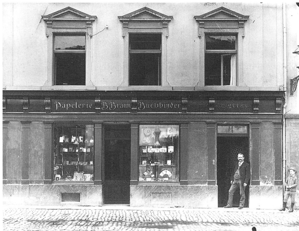
Abb. 3: Papeterie B. Braun Buchbinderei.