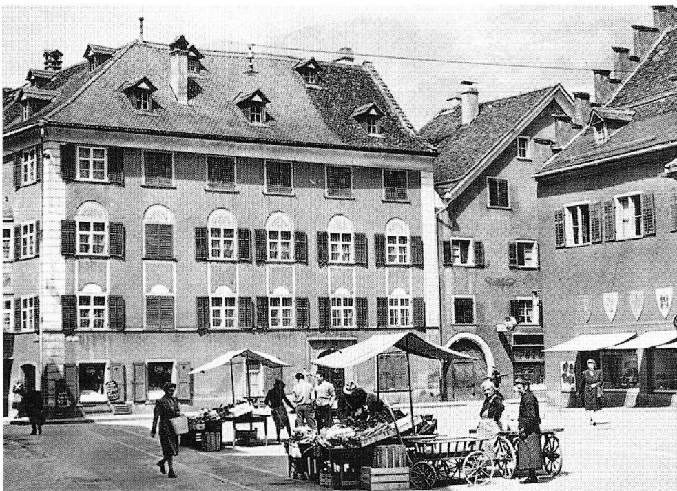
Abb. 14: Kornplatz Nr. 12, historische Aufnahme.

Zusammenfassend lässt sich festhalten, dass die Bauten, die den Kornplatz säumen, in unterschiedlichem Grad einen Wandel vollzogen haben. An der südlichen Platzfront ist im 20. Jahrhundert eindeutig eine Purifizierung der Fassaden des 19. Jahrhunderts festzustellen, wobei spätmittelalterliche Elemente beibehalten werden. Die stärksten Eingriffe betreffen jeweils das Erdgeschoss – eine Konsequenz aus der