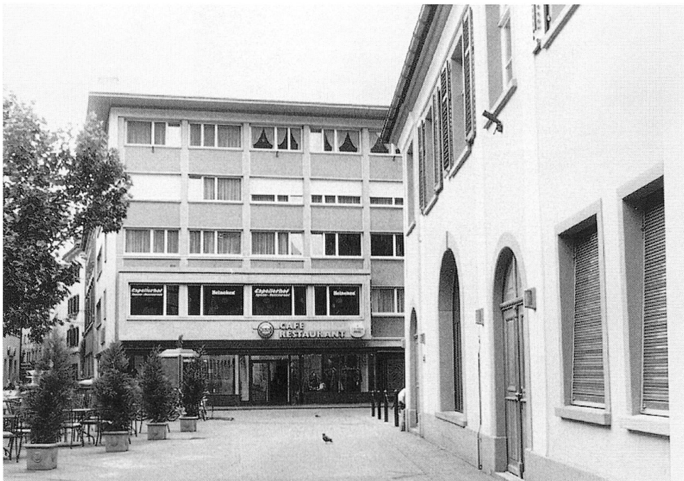
Abb. 15: Kornplatz Nr. 12, heutige Aufnahme.