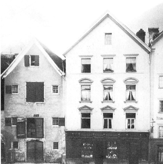
Abb. 7 unten rechts: Kornplatz 1 und 3, heutige Aufnahme.

Abb. 6 unten links: Kornplatz Nr. 1 und 3, historische Aufnahme aus: Peter Metz/Heinrich Jecklin, Chur einst und heute, Chur 1982, S. 114 unten).