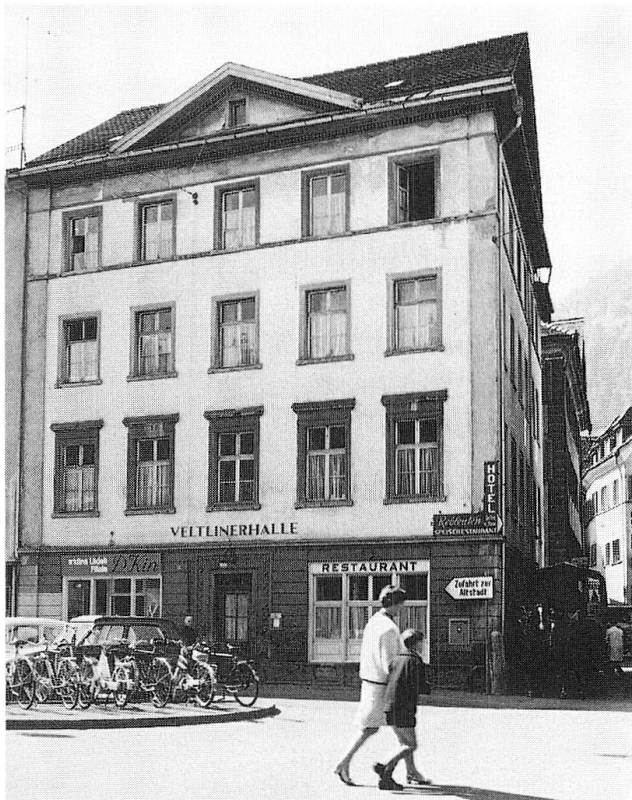
Abb. 3 unten rechts: Kornplatz Nr. 11, heutige Aufnahme.