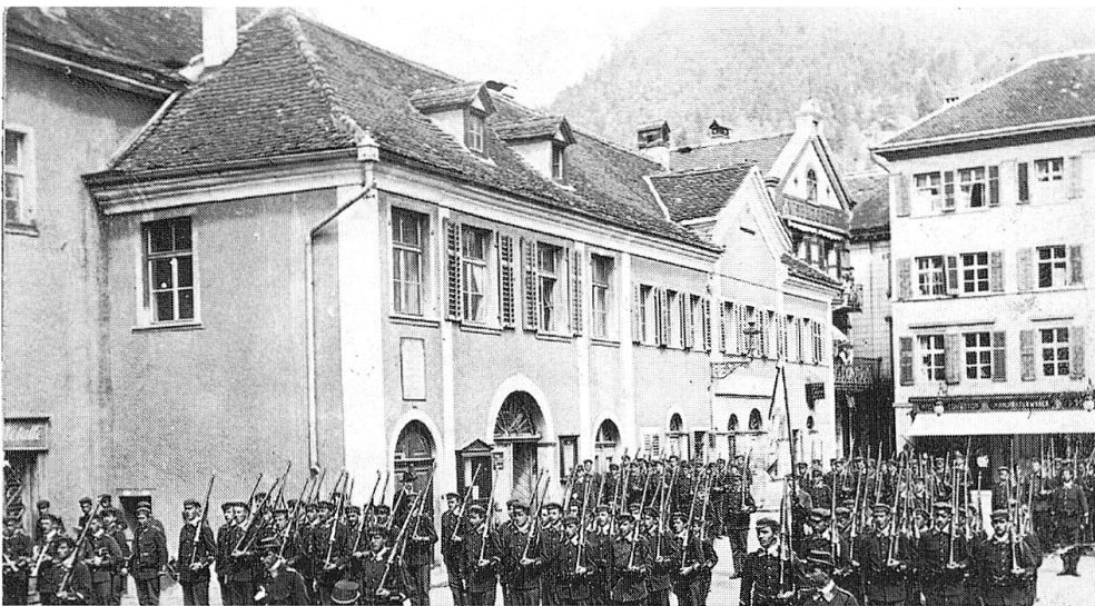
Abb. 12: Kornplatz Nr. 10, historische Aufnahme..

Abb. 11 oben rechts: Kornplatz Nr. 6, heutige Aufnahme..