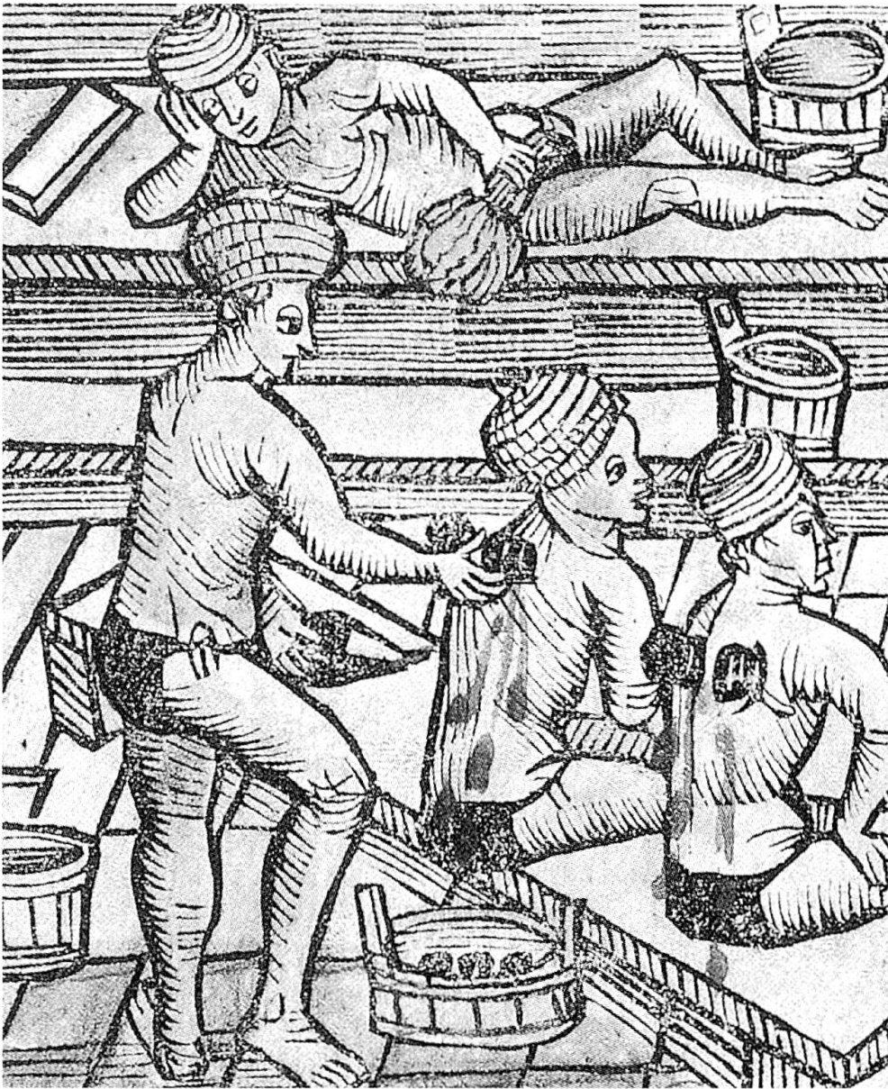
Das Schröpfen. Kolorierter Holzschnitt aus einer böhmischen medizinischen Handschrift, um 1500, Státní Kin- hovna Praha.

Hortensia von Salis beschrieb die Wirkungen des Fläscher Wassers folgendermassen: [...] dass dises Wasser unvergleichlich gut ist für allerhand Leibesschäden: ... in Summa für alle Zustände, die eine verstopfung der Lympha und des Nerven-Safftis zur Ursach haben, davon die Leibesfeuchtigkeiten und Säfte scharff und saur werden müssen. Dann dises Wasser fliesset von einer alcalischen Erden und führet Terram sigillatam bey sich, und ist seine Krafft zu trökenen, säubern, heilen und zusammen zuzuehen; fürnemlich aber die Verstopfungen zueröffnen und das scharffsaure zu verschlingen. 23