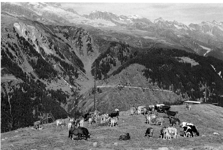
Im Val Tujetsch sind einige primäre Maiensässe («Mises») im Waldgürtel zwischen Tal und Alp entstanden: zum Beispiel Mises Grond oberhalb von Cavorgia oder Mises Bostg (rechts Mitte im Bild).

Die Sukzession führt dazu, dass die meisten Flächen, die länger brach liegen, in eine relativ stabile Waldform übergehen. Daraus ergeben sich zwei weitere mögliche Betrachtungsformen: Eine Betrachtung im nachhinein (ex post), also zu einem Zeitpunkt,