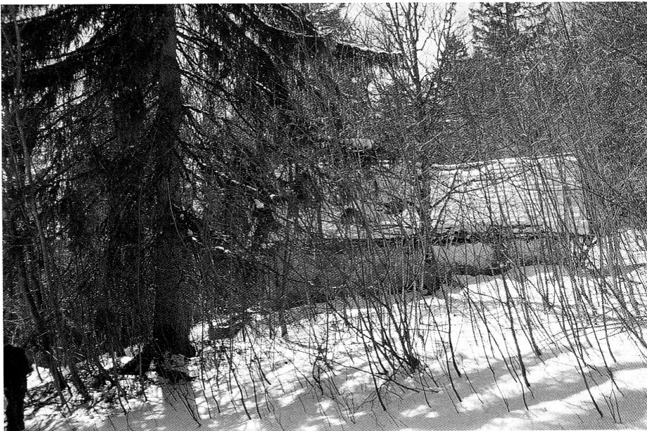
Waldausdehnung ex post betrachtet: eingewachsene Wytweide auf dem Mont Crosin.

Natur...». Dieses Argument leitete er von seinem Haus ab, wo ebenfalls der Nachbar dafür zu sorgen habe, dass seine Bäume die Grundstück-Grenzen respektierten. Damit stiess er bei anwesenden Förstern auf Widerspruch, wohl nicht zuletzt auch deshalb, weil es Formen der Verwaltung oder Verbuschung gibt, die nicht im unmittelbaren Grenzbereich von Wald und offenem Land stattfinden.