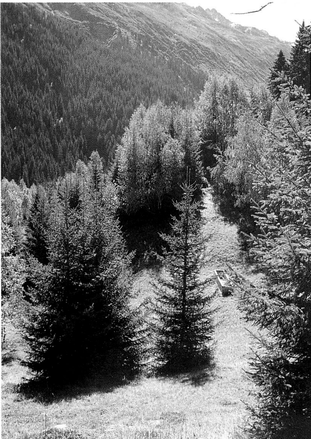
Einwachsende Wiesen oberhalb von Surrein (Val Tujetsch).

Wer hingegen einen weiteren Betrachtungsraum wählt, richtet auch auf der Suche nach Lösungen den Blick nicht mehr hauptsächlich auf die einzelbetriebliche, sondern auf die politische Ebene. So hat etwa der Bündner Grossrat Johannes Pfenninger zu bedenken gegeben, dass jede Landschaft einer Dynamik unterstellt sei und darum eine Bewirtschaftung benötige: 12 «Wir müssen für die Landwirtschaft, und speziell für diejenige im Berggebiet, gute Rahmenbedingungen schaffen, damit wir diese Kulturlandschaft in etwa so erhalten können.»