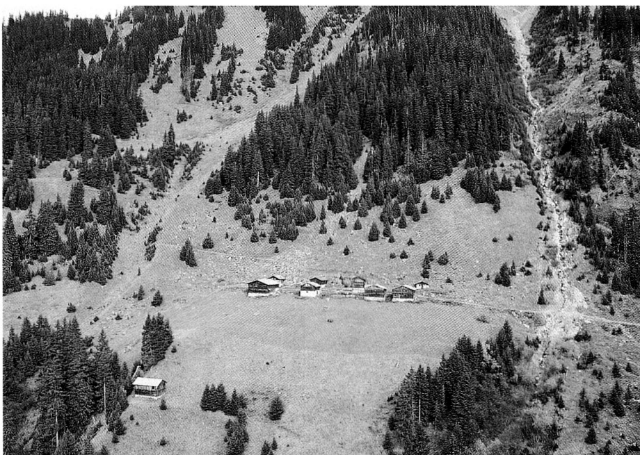
Val Bugnei (Tujetsch): Ein Muster der Waldausdehnung auf Parzellenstufe: Fichten wachsen in offenes Land.

In der Schweiz gibt das Verhältnis von Wald zu offenem Land seit langem zu grundsätzlichen Diskussionen Anlass. Ab dem Ende des 18. Jahrhunderts war es die allmähliche Verdrängung von Nutzungsrechten durch Eigentumsrechte 1 und die unter anderem damit verbundene Wald-Weide-Diskussion, die bis heute andauert. Heute ist es die Frage, wie unsere Kulturlandschaft – angesichts des Bodenverbrauches durch den Siedlungsbau, des Vorrückens des Waldes und veränderter landwirtschaftlicher Bewirtschaftung – aussehen soll. Diese Diskussionen waren und sind geprägt vom Blickwinkel des Betrachters.