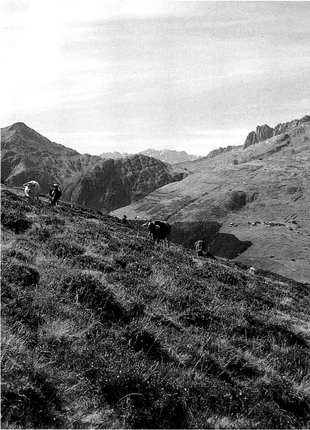
Auf Alpweiden führen sich ausbreitende Zwergsträucher zur Verbuschung, hier ein Bild von der Alp Tgom im Val Tujetsch.

Flächen «schlechtes Land» seien, dann könnte man doch in einer neuen Rodungs- und Waldpolitik diese für die heutige Bewirtschaftung ungeeigneten Flächen bestocken lassen und andere geeignete dafür roden und landwirtschaftlich nutzen.