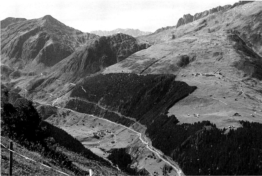
Über einen Zeitraum von Jahrhunderten betrachtet handelt es sich bei der Waldausdehnung im Val Tujetsch um eine Rückkehr des Waldes. Der Weiler «Selva» (unten Mitte im Bild) ist im Wald erbaut worden.

dehnung gleichzeitig ein schleichendes Phänomen für den Betrachter und ein (be)drängender Prozess aus der Sicht des Bewirtschafters.