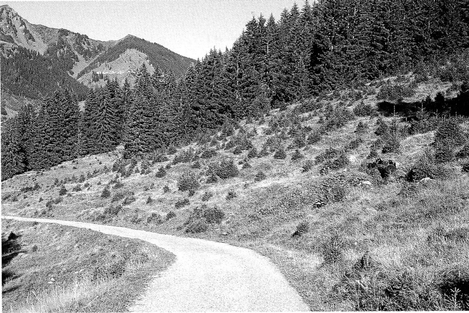
Die Waldausdehnung ex ante betrachtet bei Plaun Miež im Val Tujetsch: Fichten wachsen auf landwirtschaftlich genutztem Land, hier auf einer Weide.