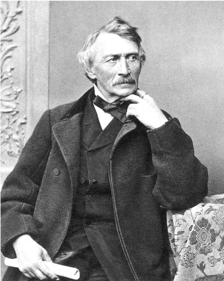
Gottfried Semper, um 1866. (Fotografie: Franz Hanfstaengel. In: Winfried Nerdinger, Werner Oechslin (Hrg.), «Gottfried Semper 1803–1879. Architektur und Wissenschaft», Zürich 2003, S. 2.)

mehreren europäischen Metropolen. Gleichwohl kommen auch in diesem einfachen Gebäude Sempers universelle Architekturtheorie und seine Entwurfsmethode zum Ausdruck. In seinen urbanen Grossprojekten, wie zum Beispiel in seinen berühmten Projekten für die Opernhäuser von Dresden, München und Wien, sind die monumentalen Bauaufgaben bautypologisch und architektonisch reflektiert, tradierte Architekturformen sind neu interpretiert und in einen städtebaulichen Zusammenhang eingebunden. Auch die Bauaufgabe des einfachen Wohnhauses in ruraler Umgebung an der Grenze zu Italien fand eine ganz spezifische Zuordnung im Bautyp des italienischen Landhauses, der casa rustica . Die Villa verkörpert so einen Bautyp des 19. Jahrhunderts; ihre Bauform widerspiegelt die Rezeption anonymer Bauernhausarchitektur der italienischen Campagna wie auch des