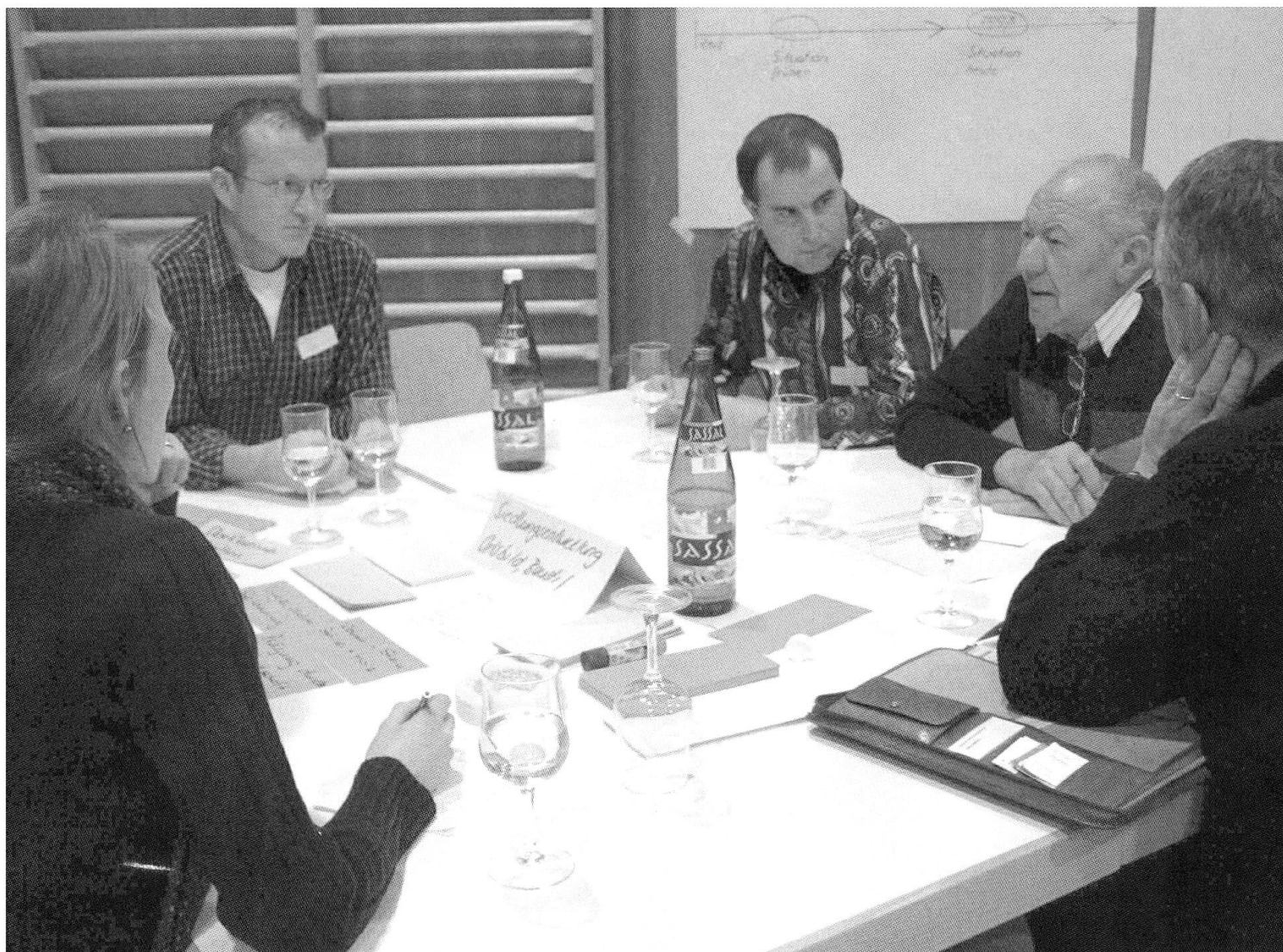
Gruppe von diskutierenden Teilnehmern an der Konsenskonferenz in Alvaneu Dorf im November 2003.

ten Jahren entwickelten Verfahren der Konsensfindung. Ein solches Verfahren, die Konsenskonferenz, wurde im Rahmen des Projektes in den beiden Teilregionen Albulatal und Surses durchgeführt. Das Ziel war ein doppeltes: Einerseits sollten dadurch die Forschungserkenntnisse direkt für die regionale Entwicklungsplanung nutzbar gemacht werden, und andererseits wollte man herausfinden, ob solche Konsensfindungsverfahren tatsächlich die erwünschte Wirkung haben.