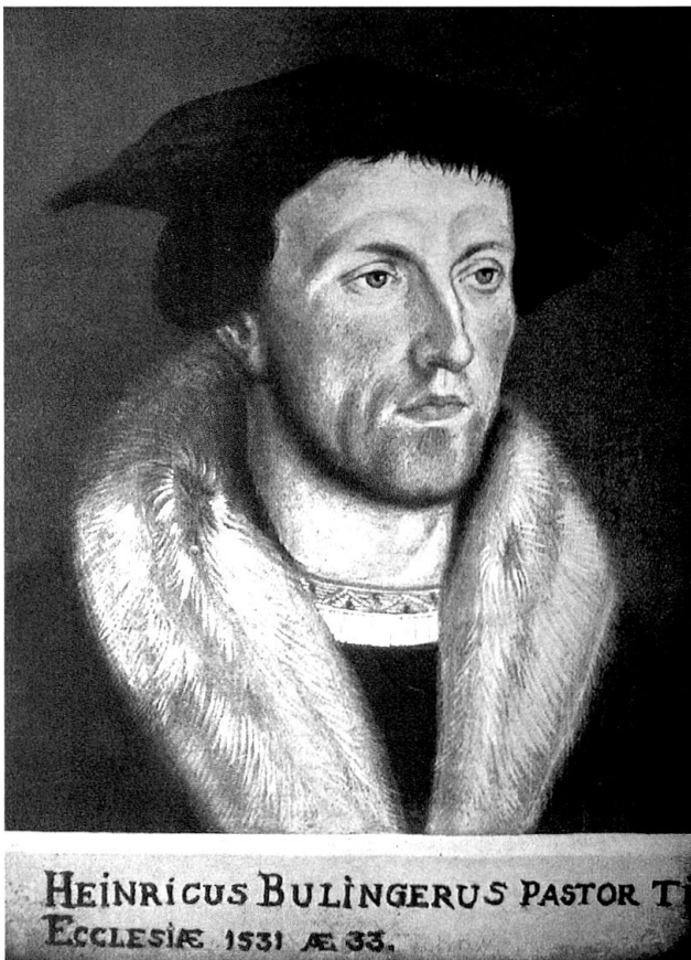
Heinrich Bullinger im Alter von 33 Jahren – unbekannter Künstler.

In der Reformationsgeschichte des Freistaates Gemeiner Drei Bünde nimmt die Einführung der Reformation in den Gemeinden des Engadins, dem Hochtal des Inns, eine besondere Rolle ein. 2 Für die entstehende reformierte Kirche des Freistaates war die Reformation der Gemeinden im Engadin von besonderer Wichtigkeit. Bis zum Ende des 16. Jahrhunderts entstand hier, mit der Ausnahme des Dorfes Tarasp im Unterengadin, das grösste geschlossene Gebiet reformierten Bekenntnisses im Freistaat Gemeiner Drei Bünde. Die Entwicklung, die dazu führte, verlief sehr kontrovers. In kaum einem anderen Teil des Freistaates wirkte sich die weitgehende Gemeindeautonomie 3 so