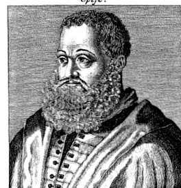
Hic est VERGERIVS, Roma qui missus ab urbe Germanos inter Pontificem celebrat. Tandem LUTHERVM laudat Christi que ministros: Atque Antichristum Pontificem esse probat.

Pietro Paolo Vergerio – wahrscheinlich nach einem zeitgenössischen Originalstich.