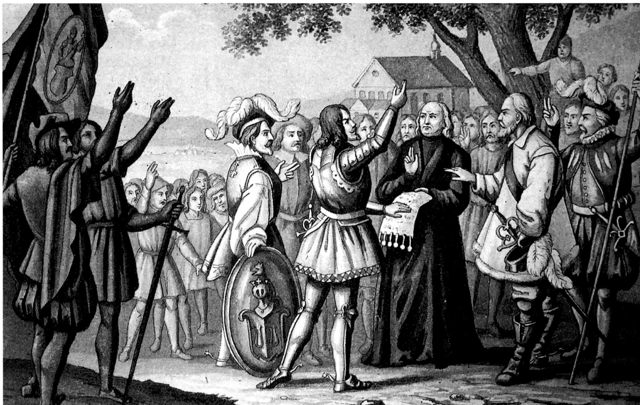
«Der Schwur zu Truns, 1424», Aquatinta von Ludwig Kühlen- thal. (Kantonsbibliothek Grau- bünden, Geschichtsbilder, GE 4/2)

im Jahre 1708. Der Dreiervorschlag des Abtes Adalbert III. de Funs lautete: